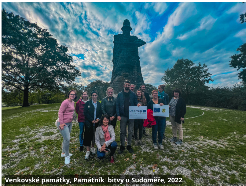
Venkovské památky, Památník bitvy u Sudoměře, 2022