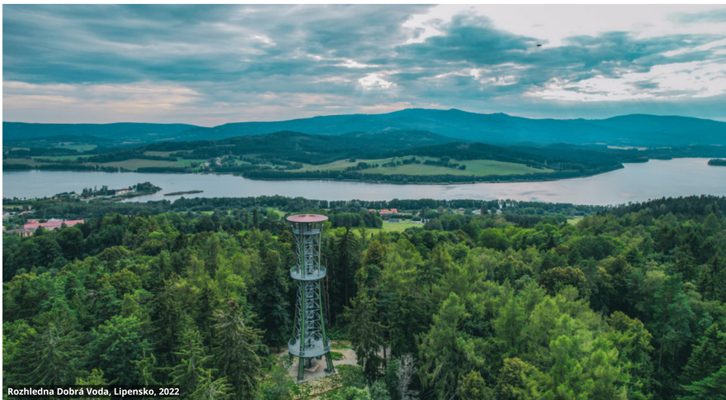
Rozhledna Dobrá Voda, Lipensko, 2022