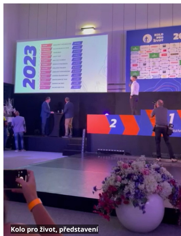
Kolo pro život, představení