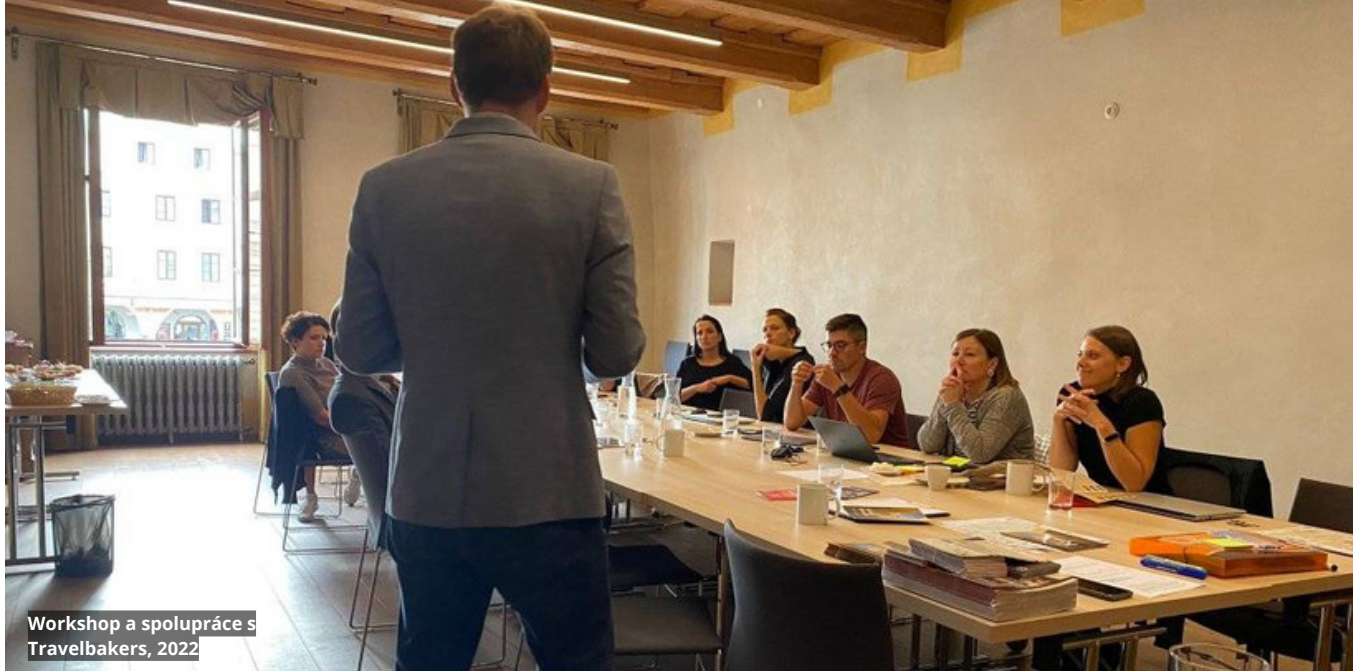
Workshop a spolupráce s Travelbakers, 2022