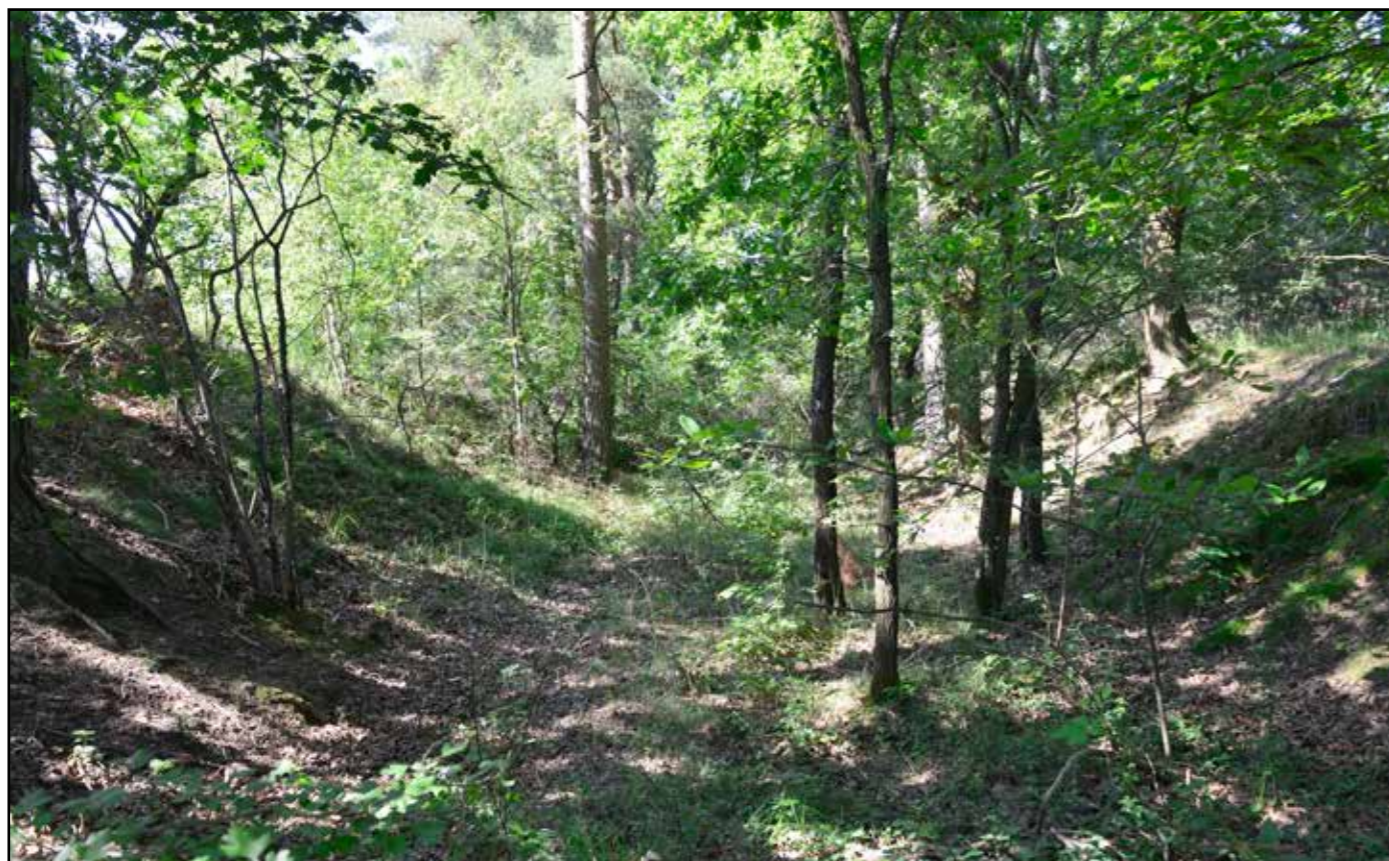
Pohled do zářezu, 2022.