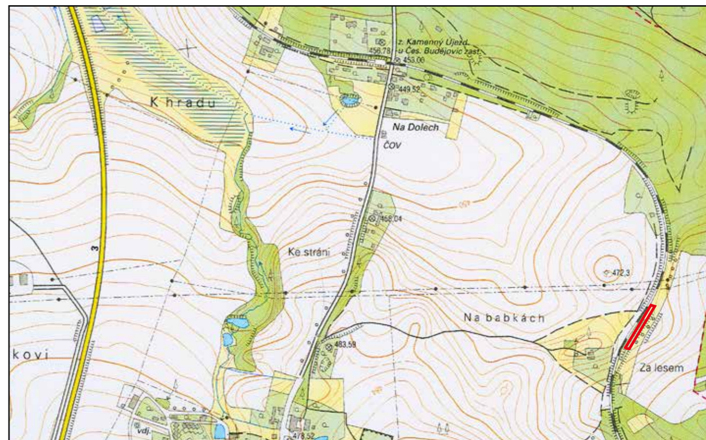
Základní mapa ČR, 2006, M 1 : 10 000.