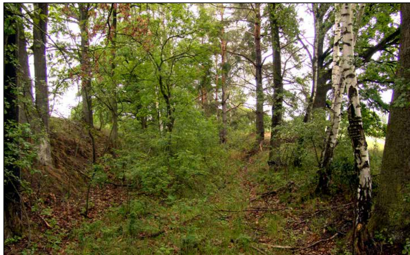
Pohled na zárez od severu, 2007.