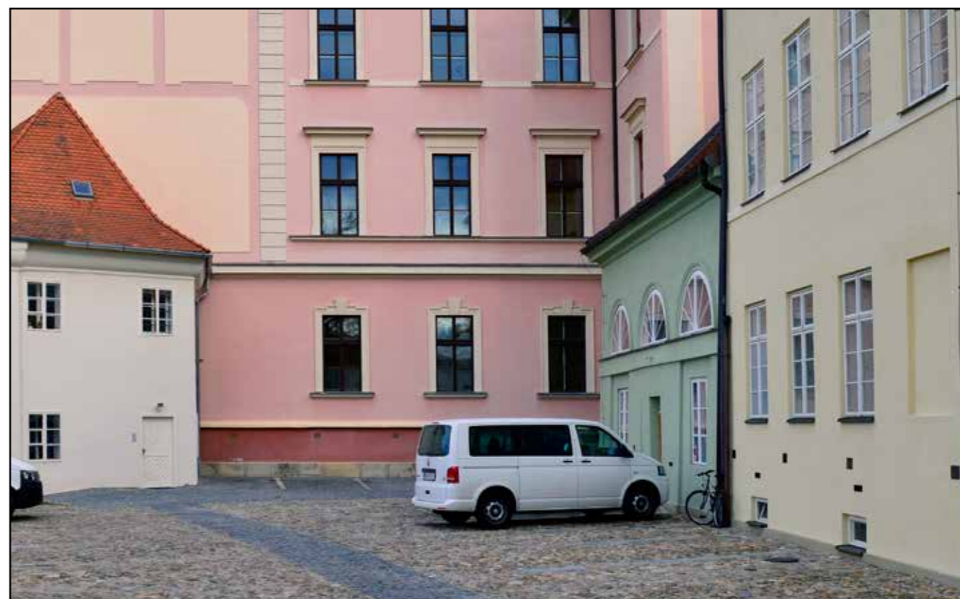
Sklad soli, pohled na západní průčelí ze dvora, 2022.