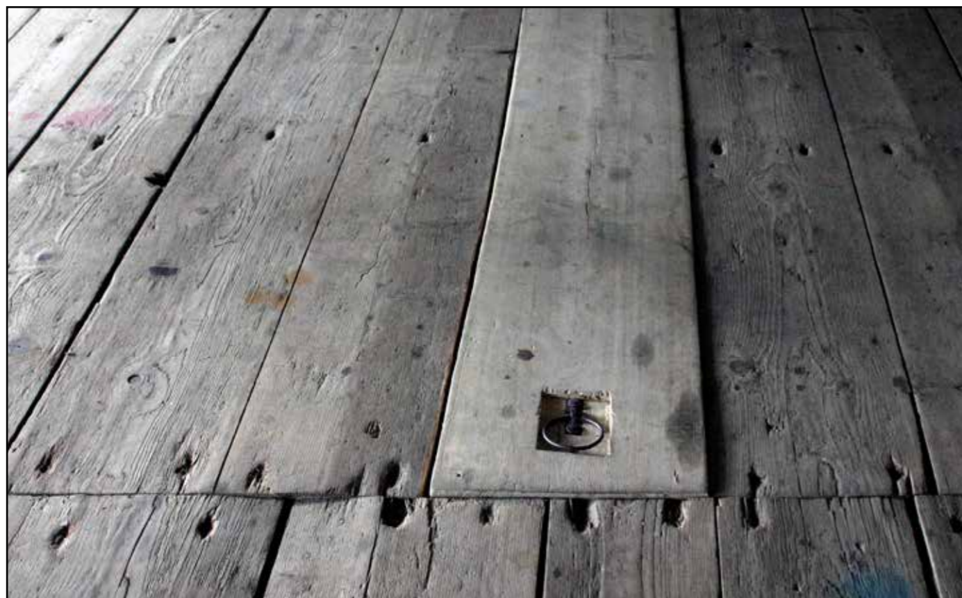
Sklad soli, dřevěná podlaha v patře, 2007.