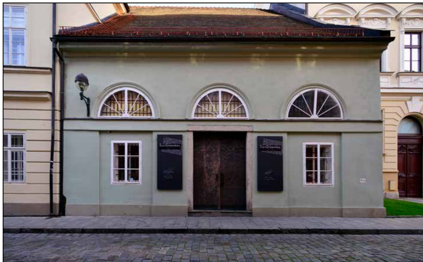
Relikt solního skladu, východní průčelí, 2022.