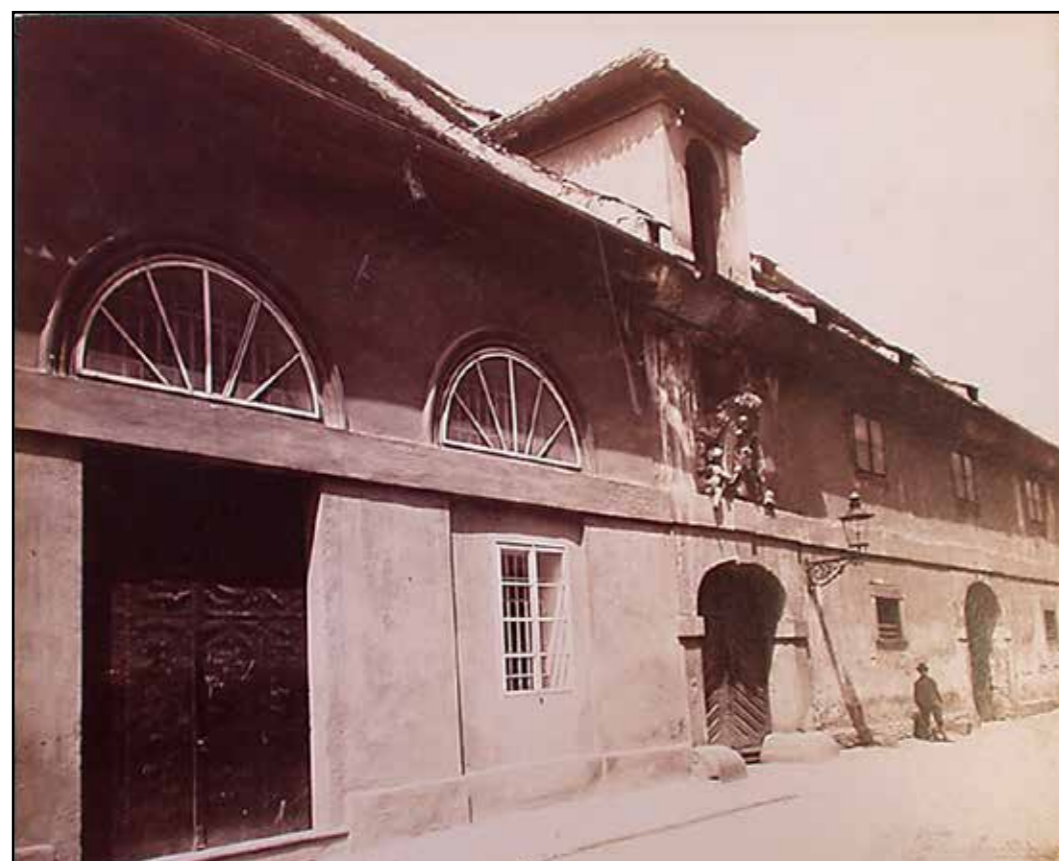
Solní sklad, pohled od jihovýchodu, 1901.