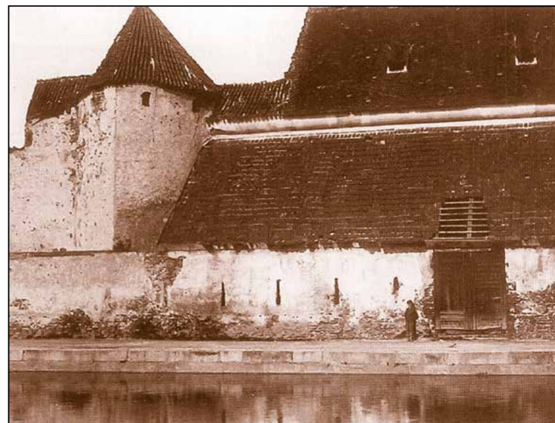
Sklad soli, pohled od západu, 1901.