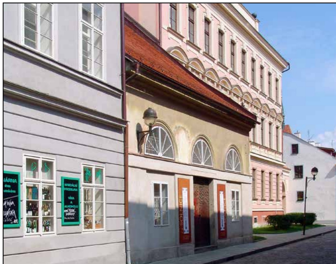
Relikt solního skladu, pohled od jihu, 2007.