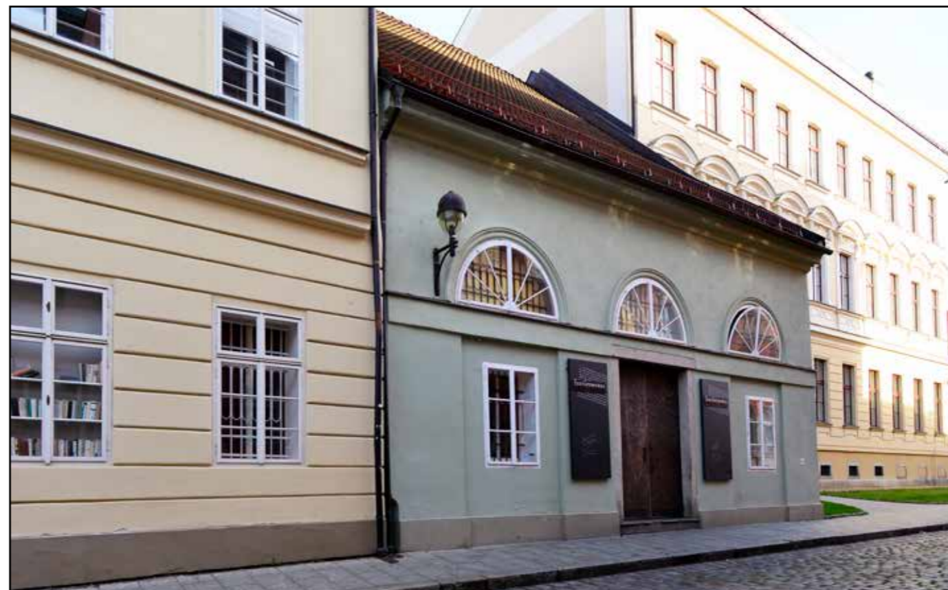
Relikt solního skladu, pohled od jihu, 2022.