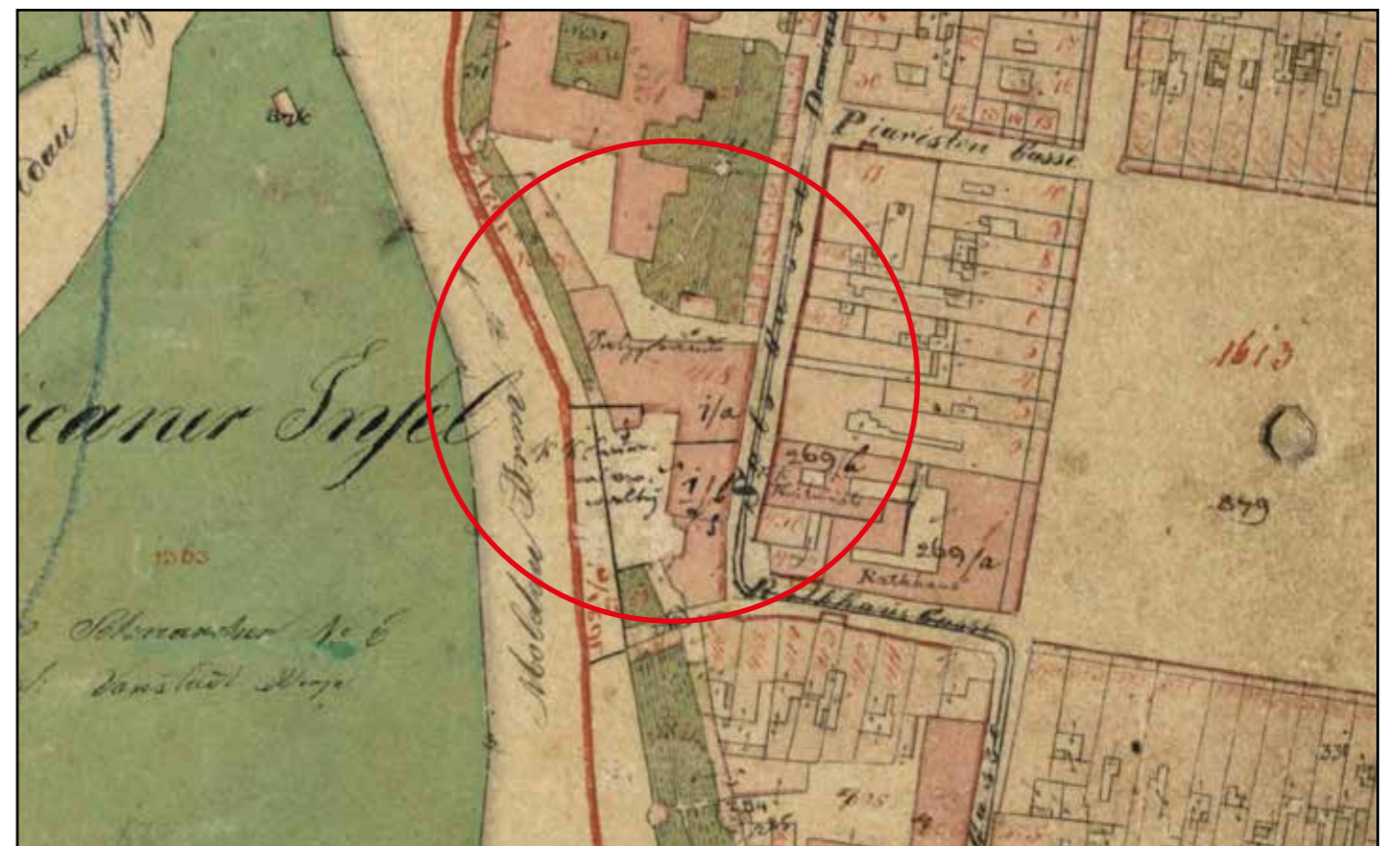
České Budějovice, indikační skica, 1827-1868.