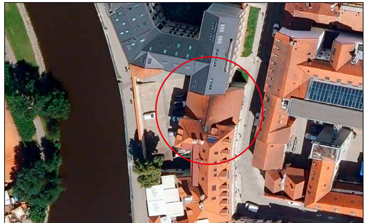
Relikt solního skladu, letecký snímek, 2022.