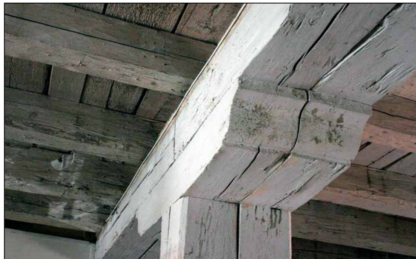
Sklad soli, konstrukce stropu a hlava podpůrného pilíře, 2007.