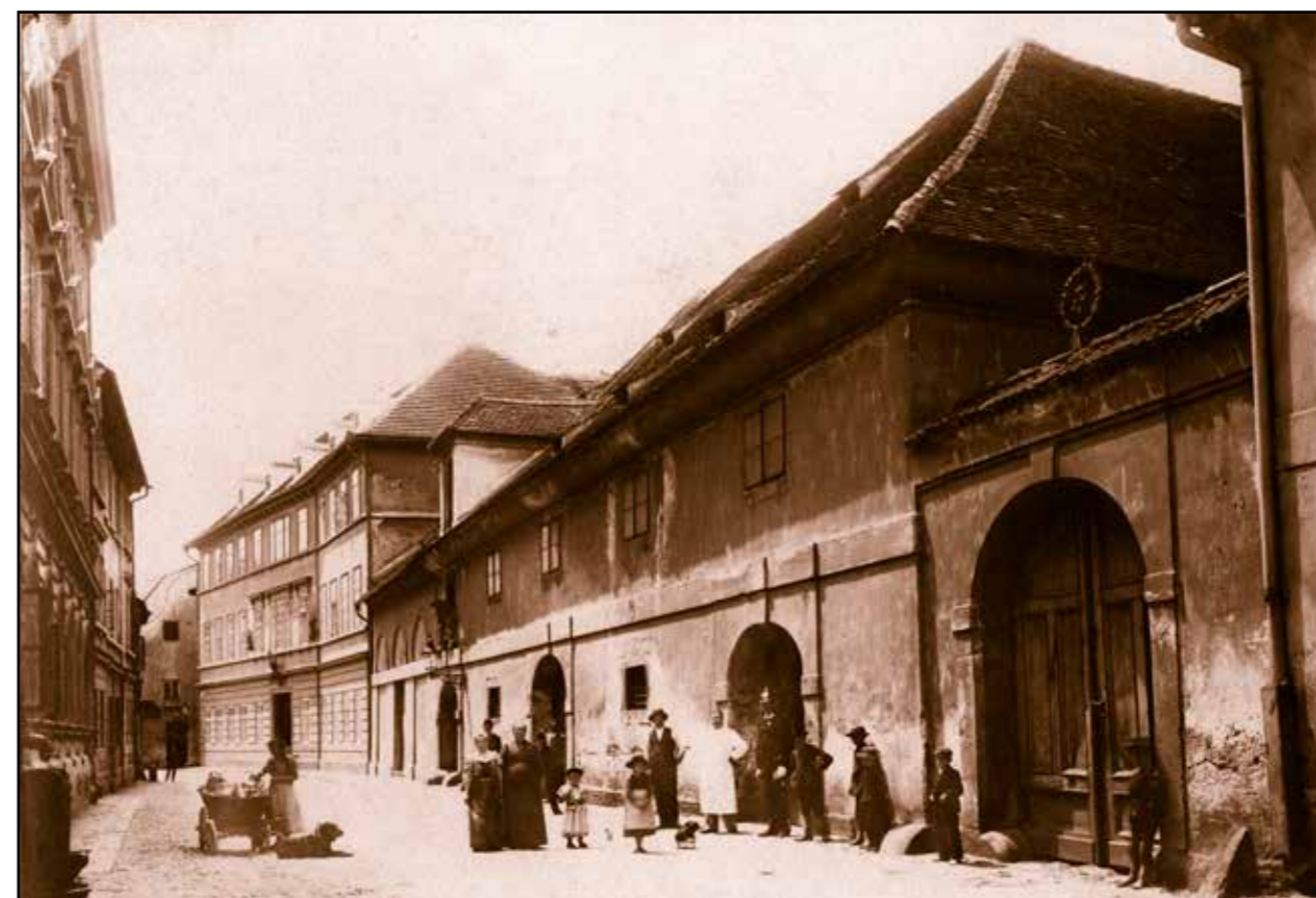
Solní sklad, pohled od severovýchodu, 1901.