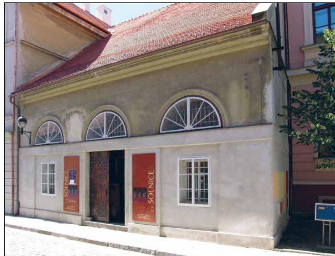
Relikt solního skladu, východní průčelí, 2007.