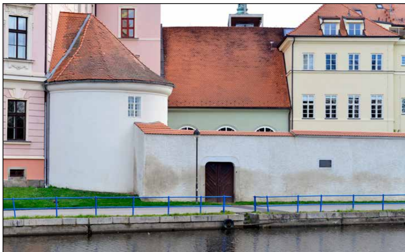
Sklad soli, pohled od západu, 2022.