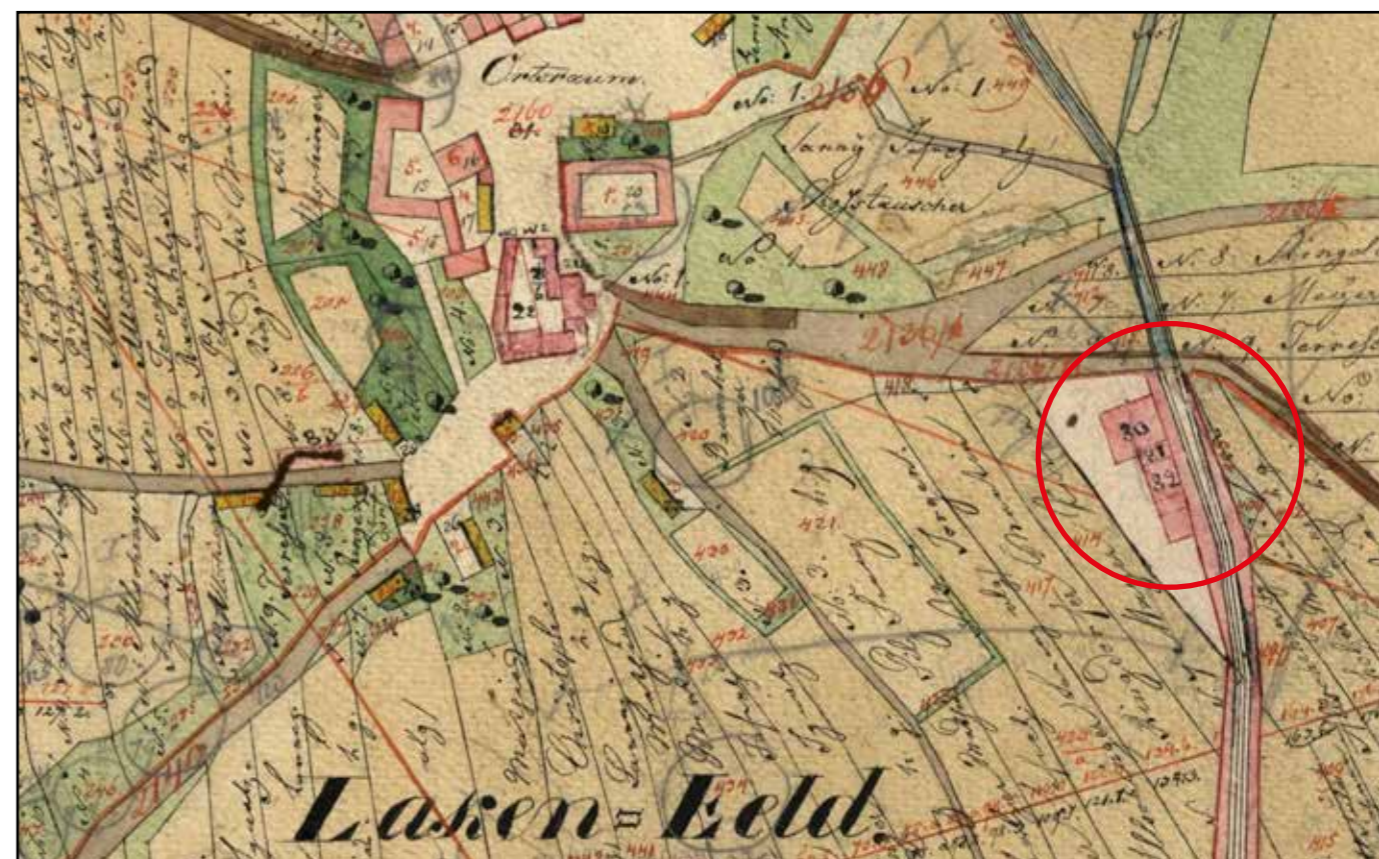
Lokalizace přeprážní stanice na indikační skice stabilního katastru, 1827-1868.