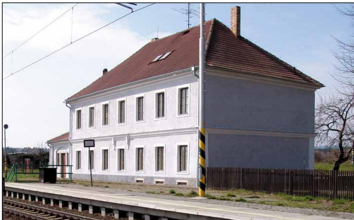
Bujanov, pohled severovýchodní, 2007.