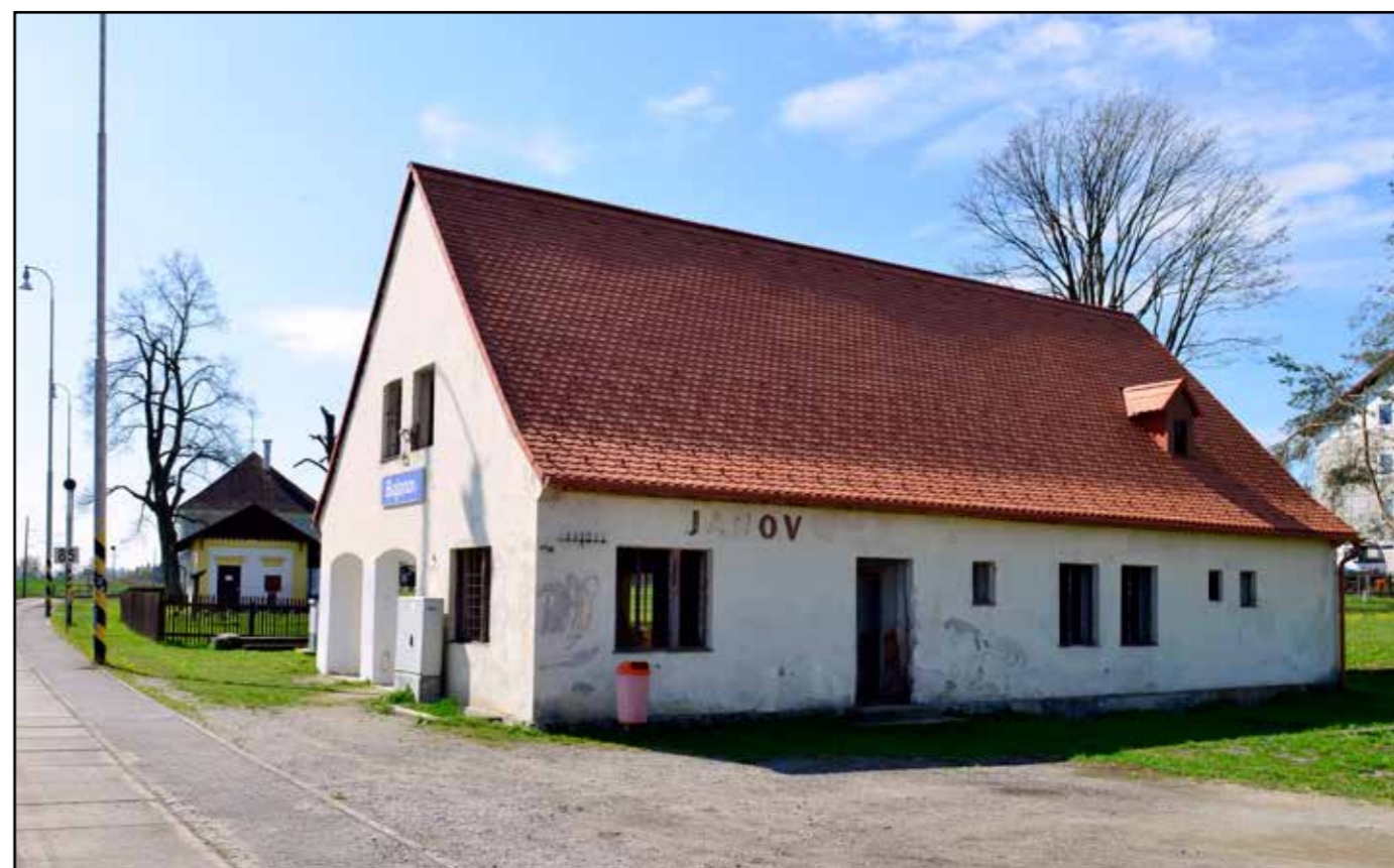
Bujanov, objekt zastávky, kde má vzniknout infocentrum, 2022.