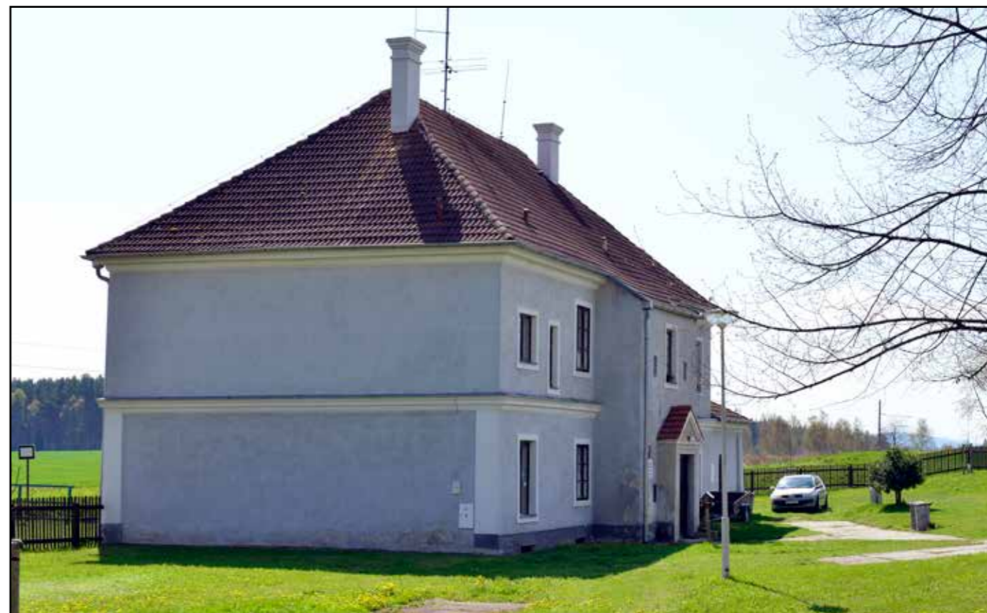
Bujanov, pohled od severu, 2022.