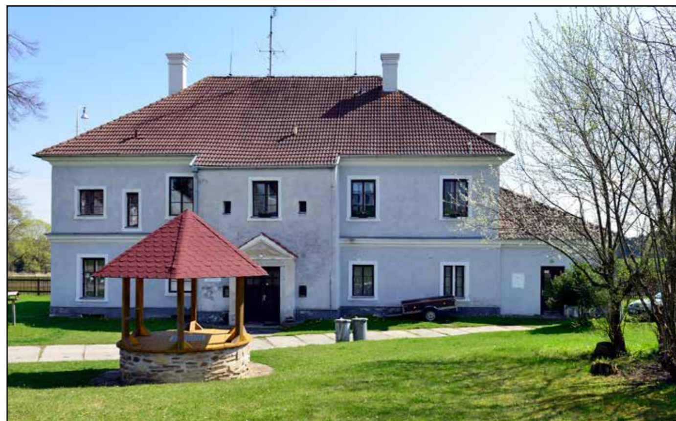
Bujanov, pohled od západu, 2022.