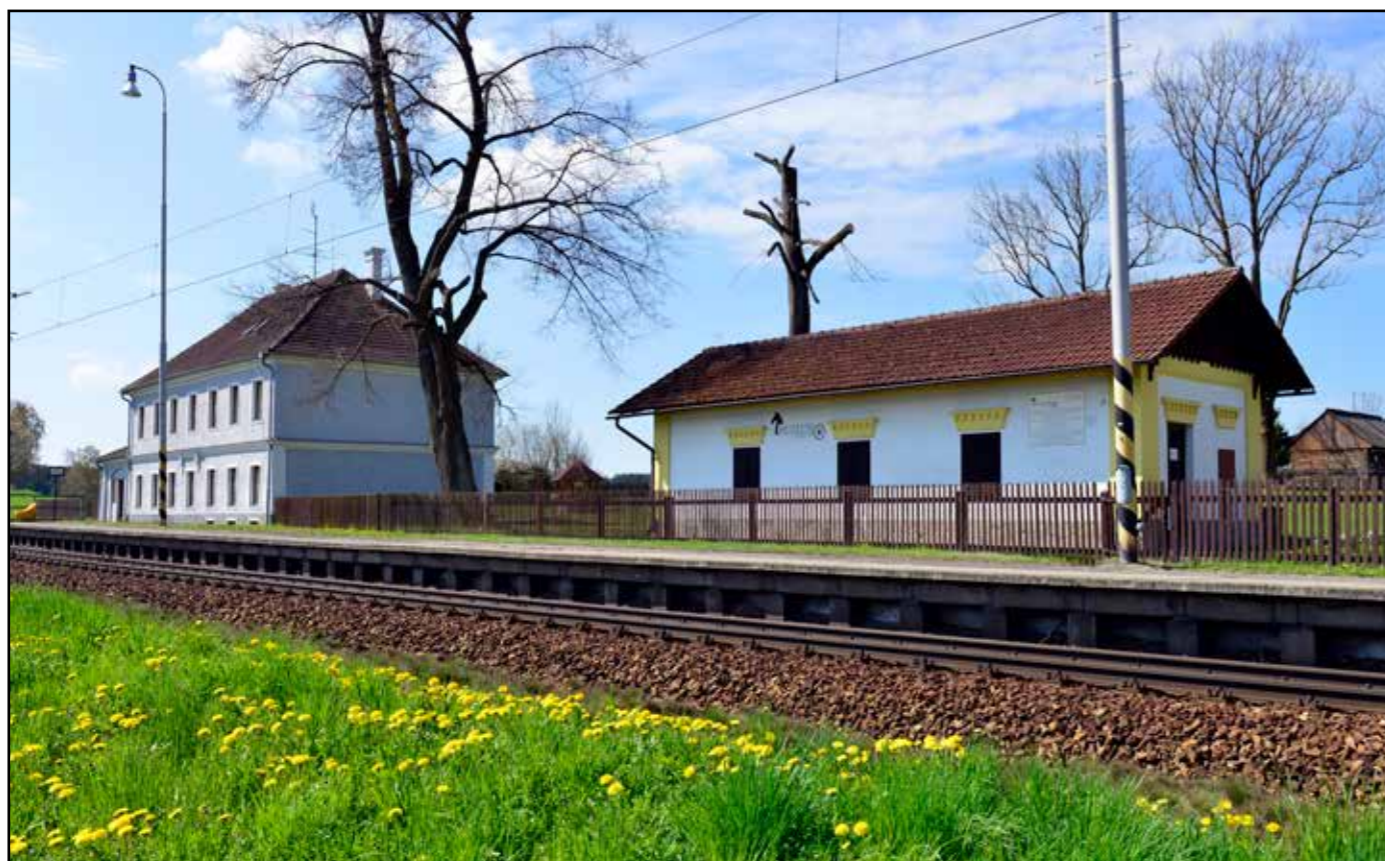
Bujanov, budova stanice a strážní domek, kde je umístěno muzeum, 2022.