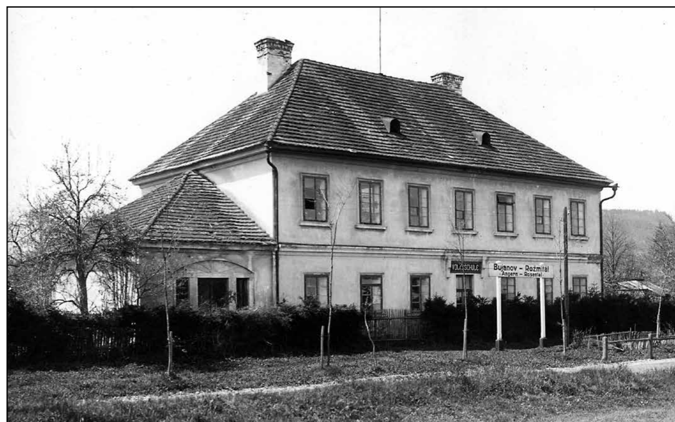
Bujanovský stanice, stav v roce 1925.