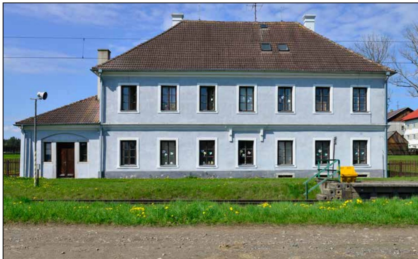
Bujanovská stanice, pohled od východu, 2022.