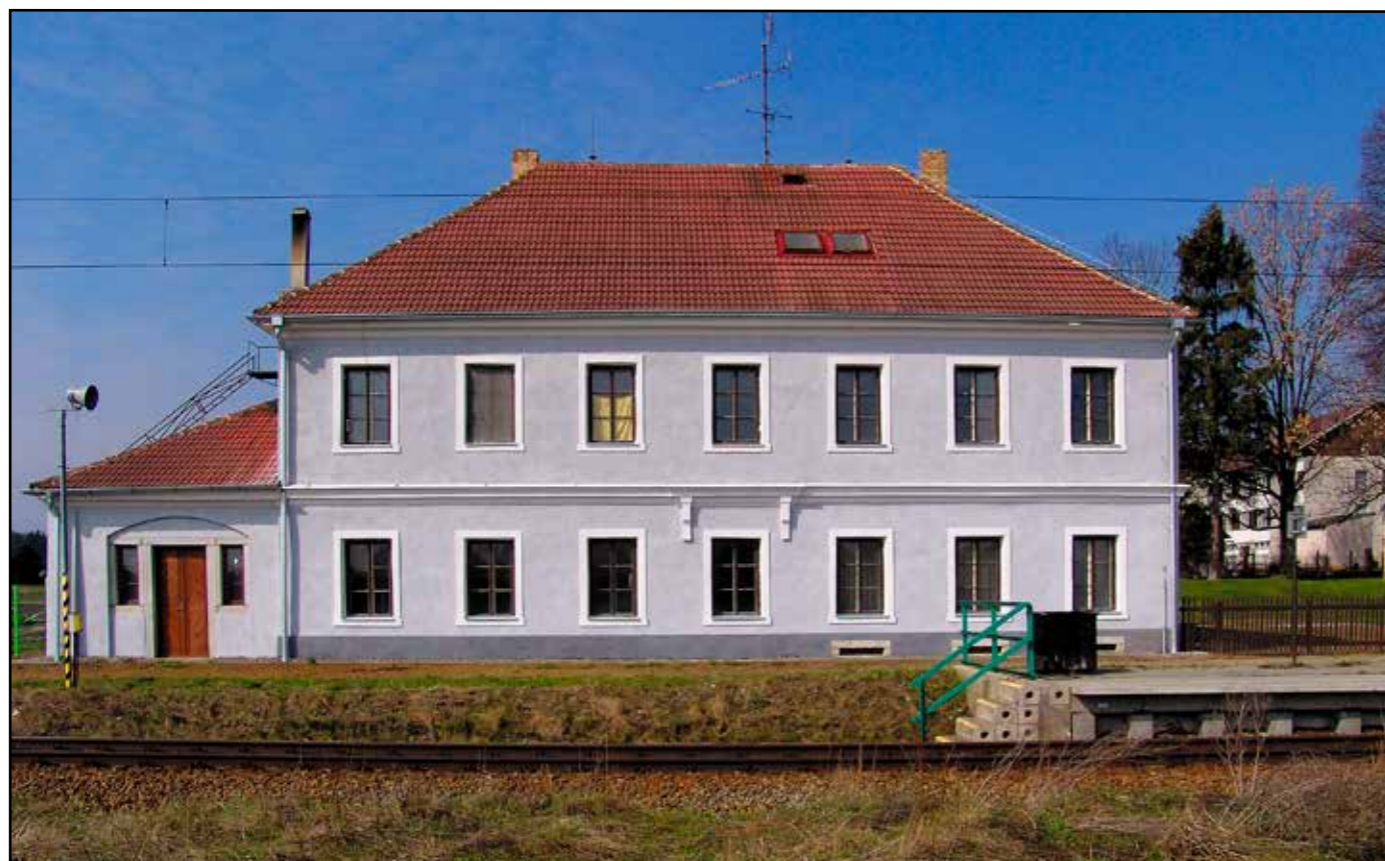
Bujanovská stanice, pohled od východu, 2007.