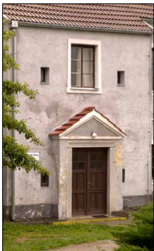
Bujanov, zachovalý západní vstup do objektu, 2007.