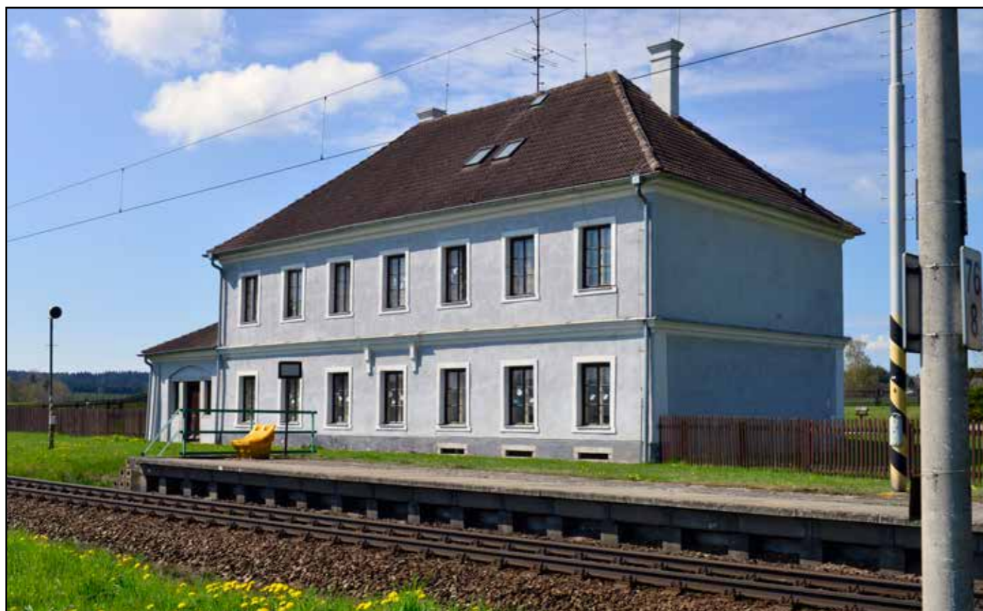
Bujanov, pohled severovýchodní, 2022.