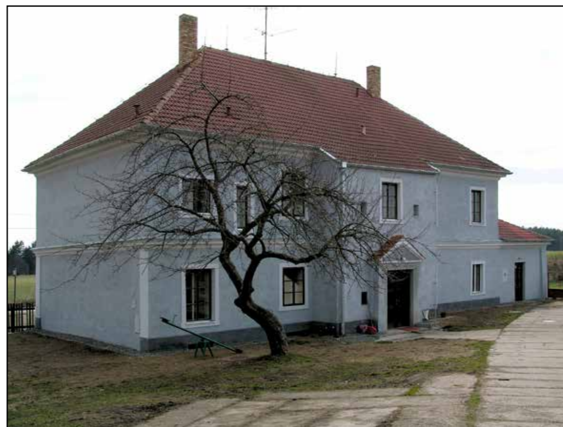
Bujanov, pohled severozápadní, 2007.