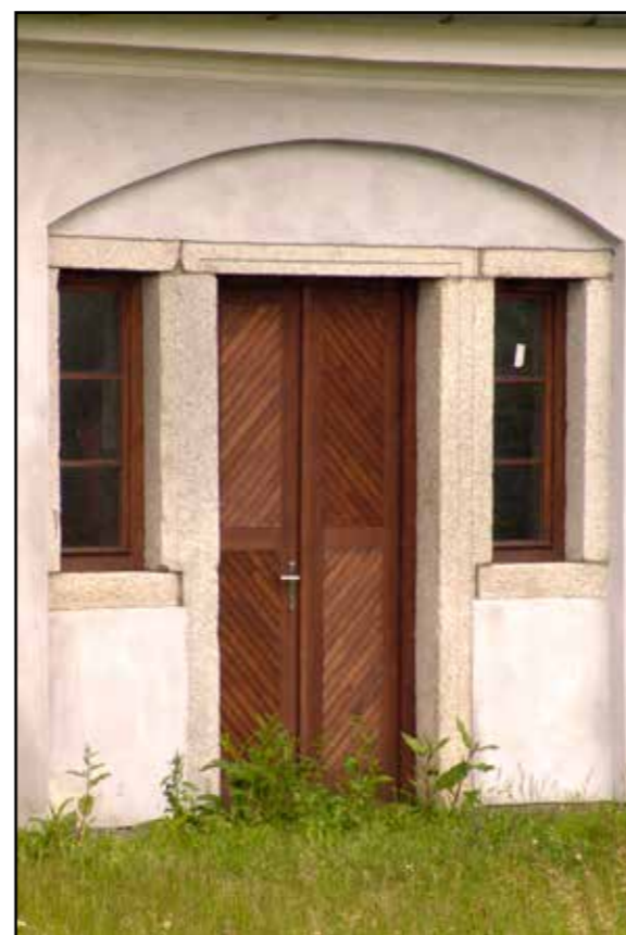
Bujanov, detail bývalého vstupu do kovárny, 2007.