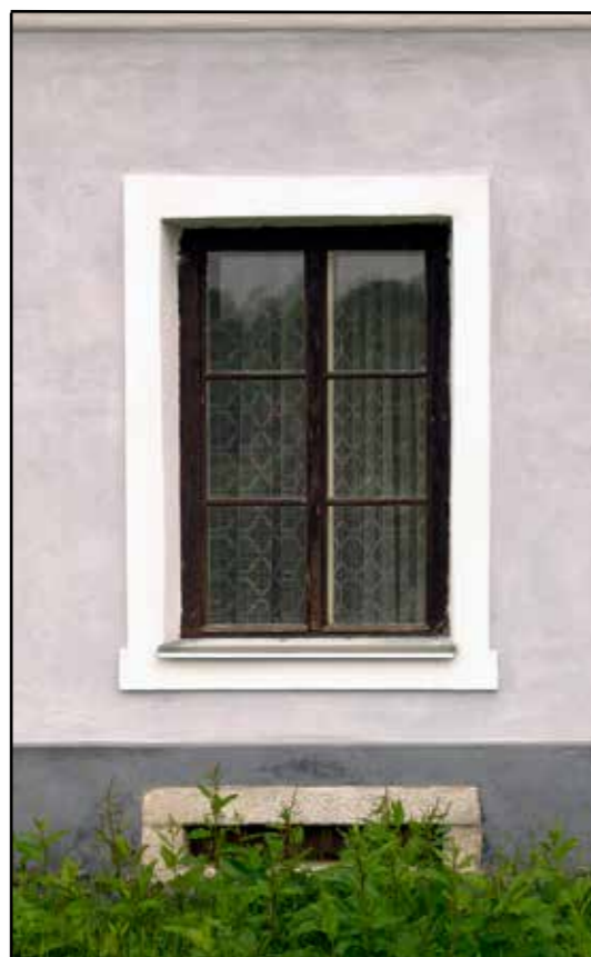
Bujanov, detail okna a sklepního okénka na východní straně, 2007.