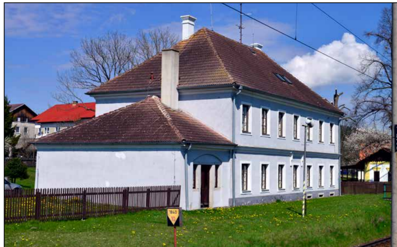
Bujanov, jihovýchodní pohled, 2022.