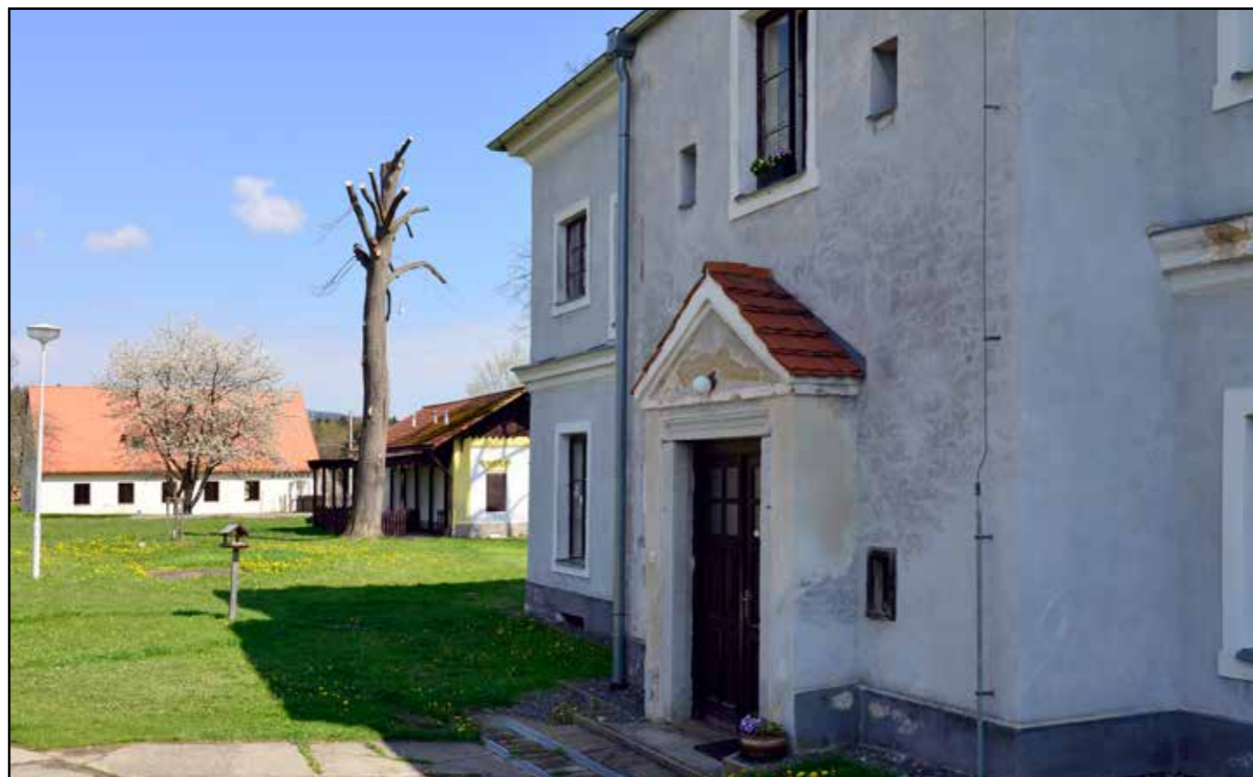
Pohled od jihu na rizalit se vstupními dveřmi, 2022.