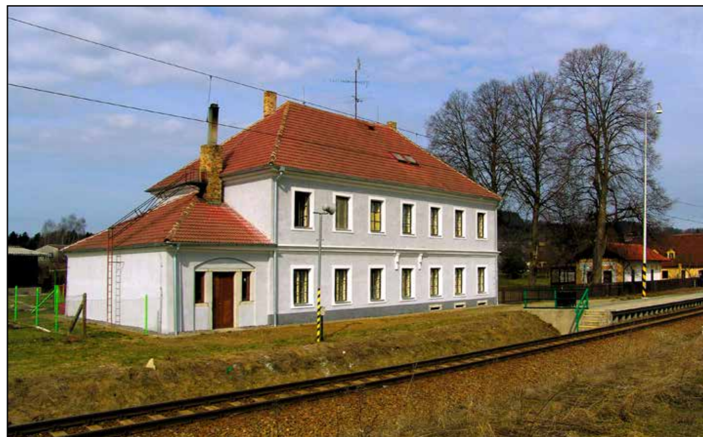
Bujanov, jihovýchodní pohled, 2007.