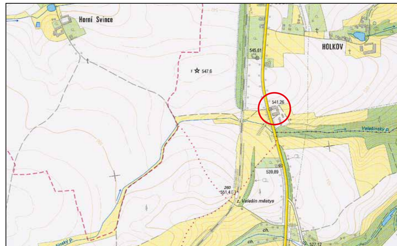
Základní mapa ČR, 2006, M 1 : 10 000.