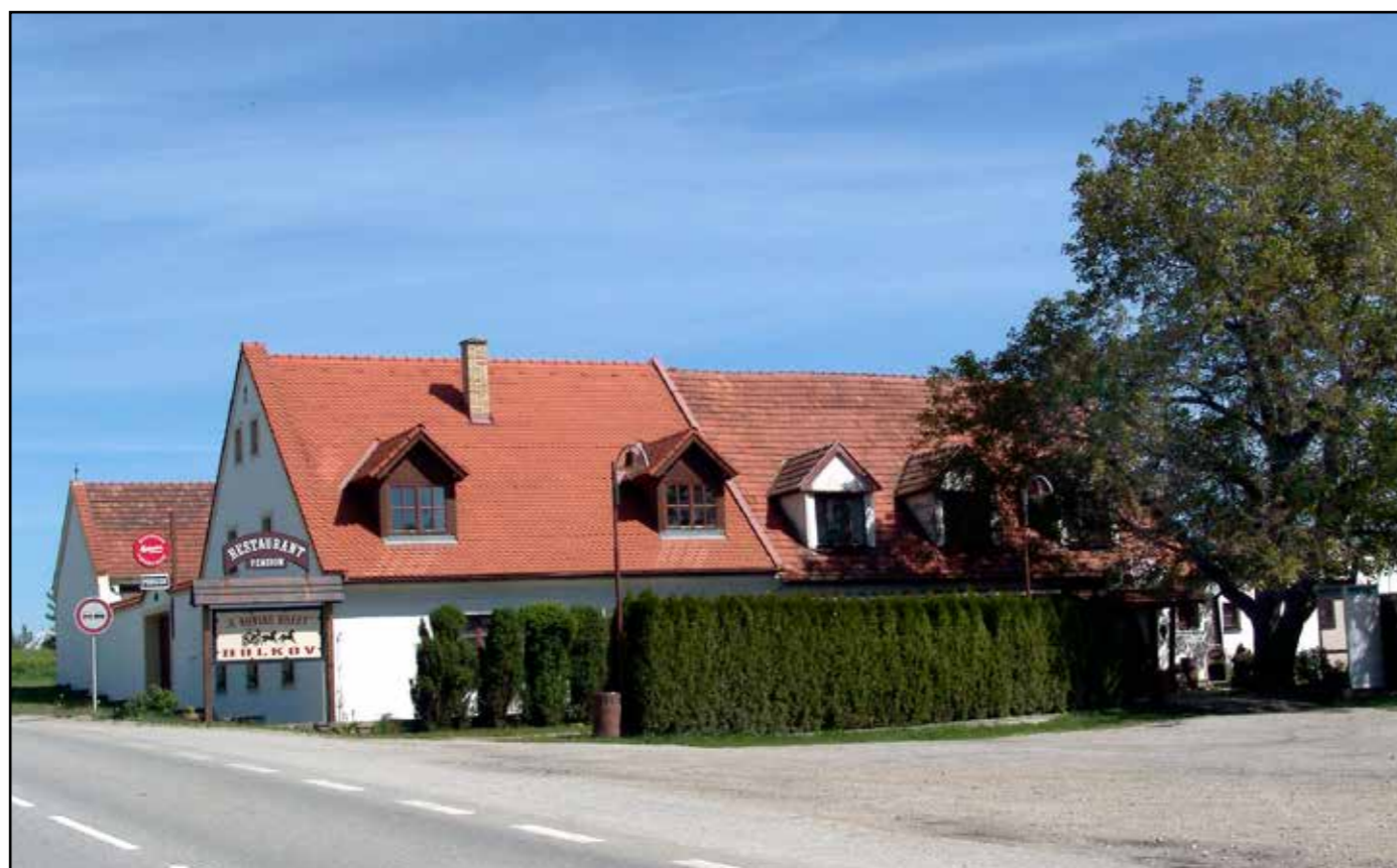
Pohled na objekt tzv. „kočárovny“ od jihu, 2007.