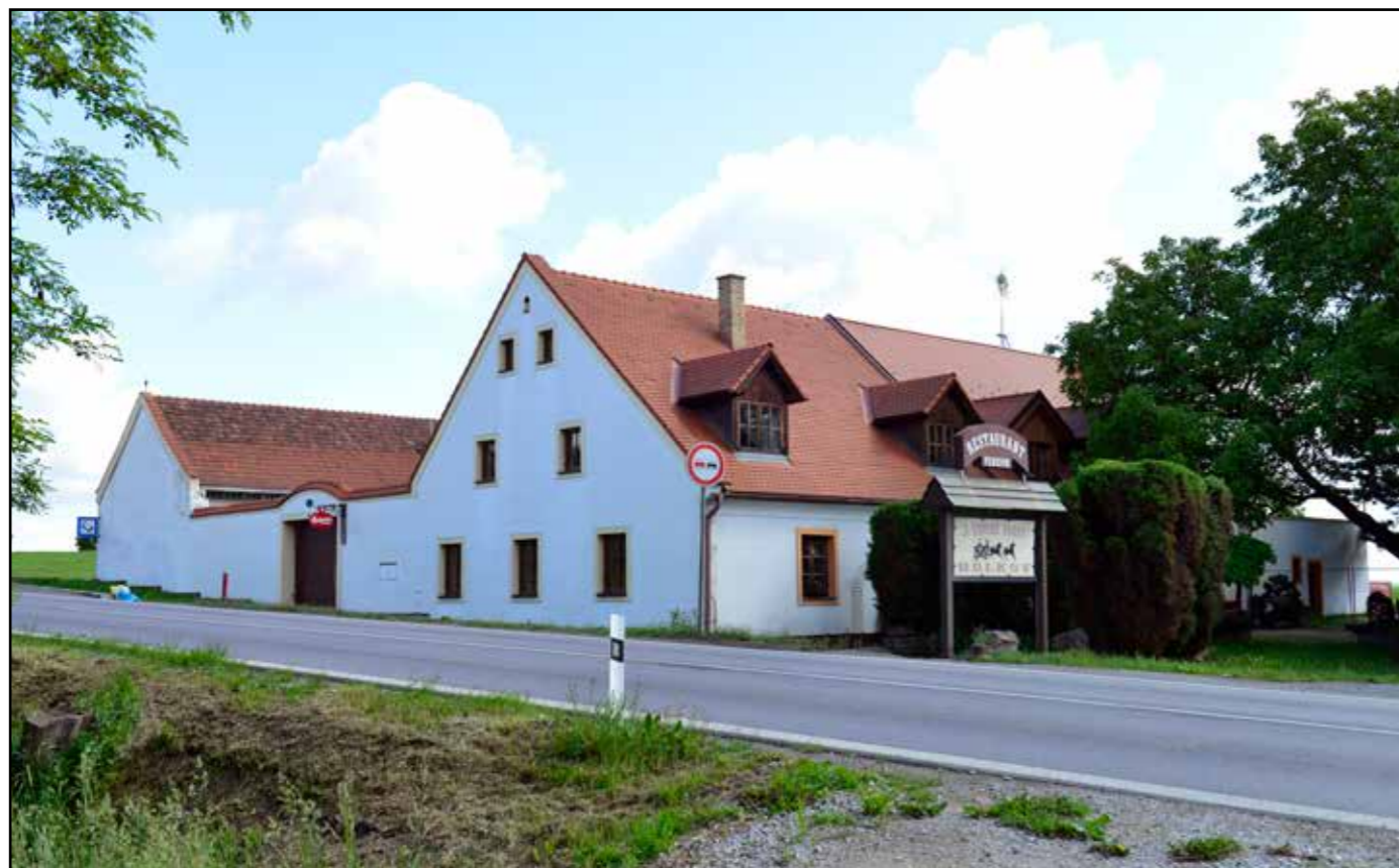
Pohled na objekt tzv. „kočárovny“ od jihu, 2022.