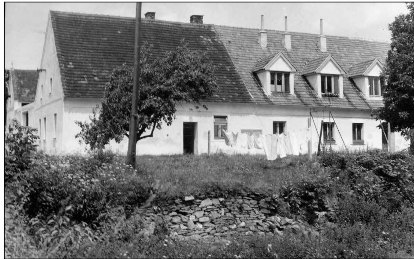
Objekt tzv. „kočárovny“ v roce 1968. V popředí již neexistující (zavezené) jádro náspu.