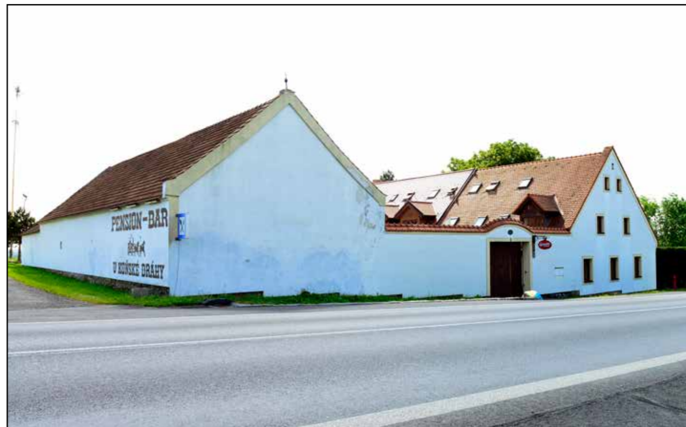
Pohled na objekt tzv. „kočárovny“ od severu, 2022.