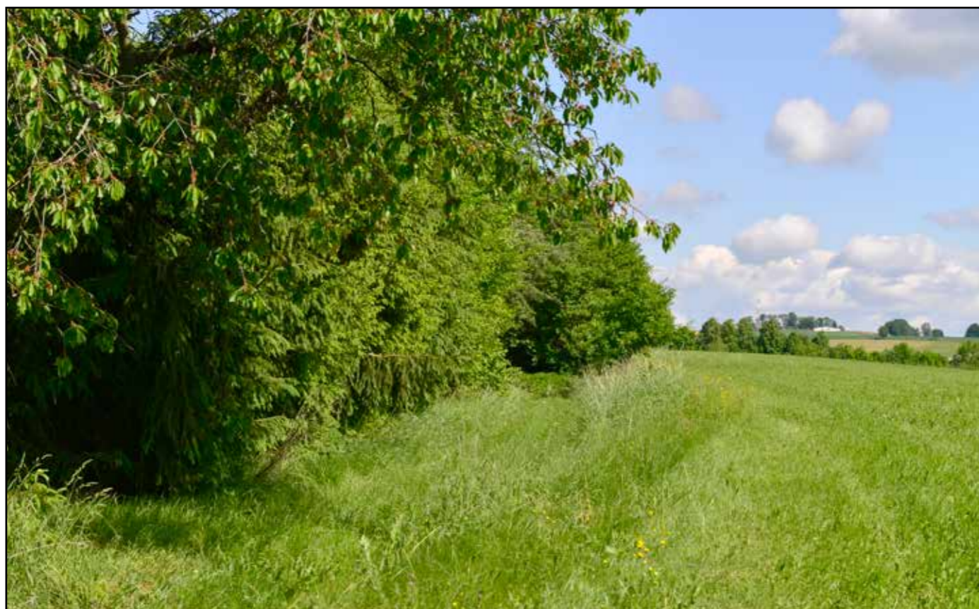
Pohled na jižní ústí zřezu, 2022.