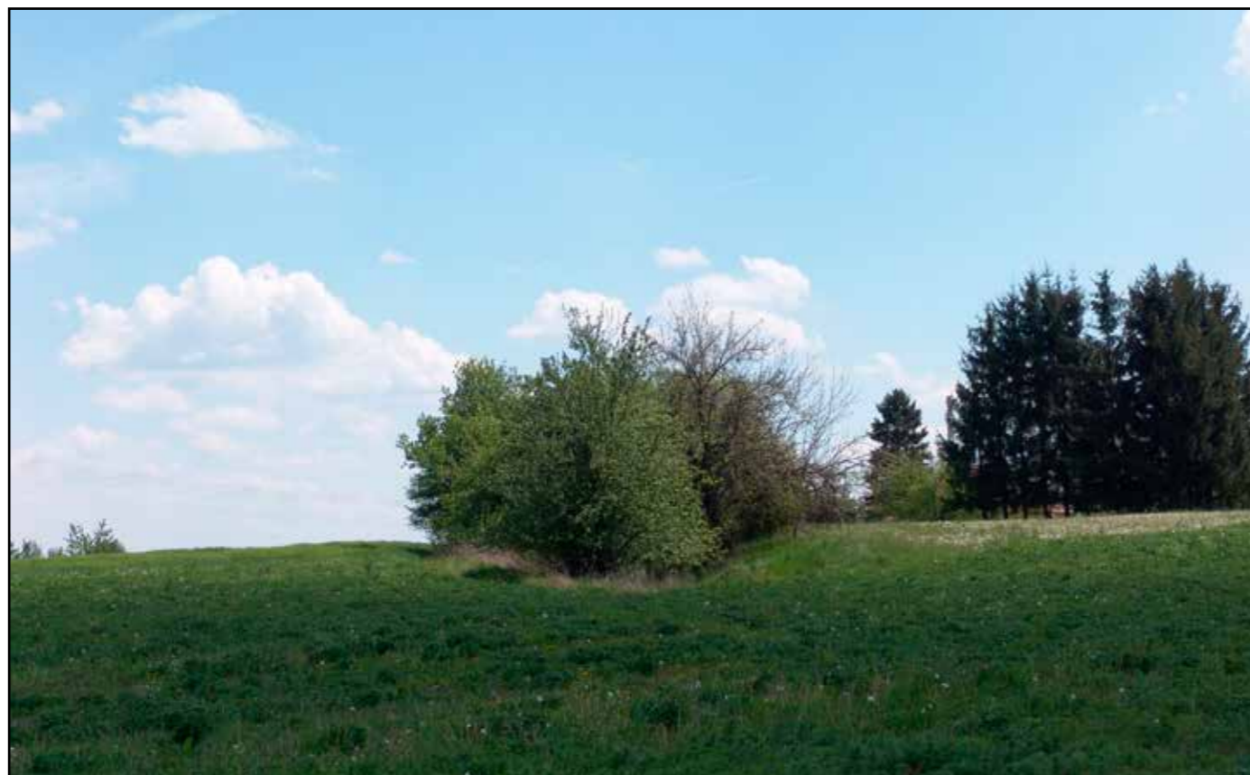
Pohled na severní ústí zřezu, 2007.