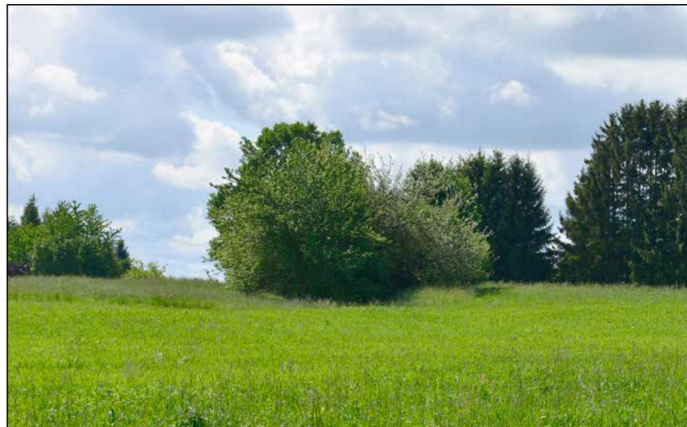
Pohled na severní ústí zřezu, 2022.