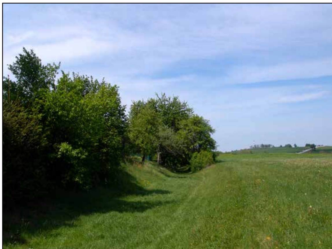
Pohled na jižní ústí zřezu, 2007.