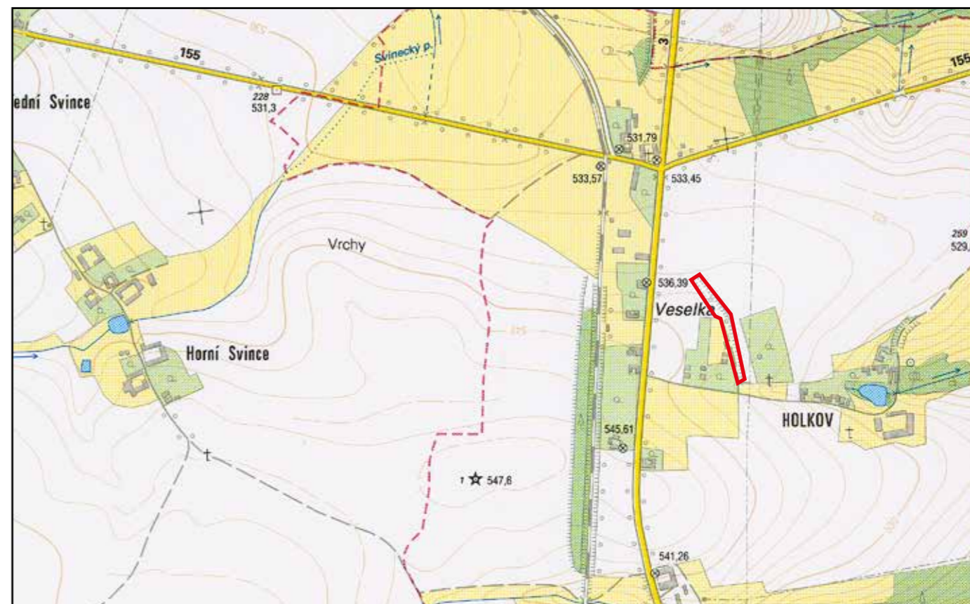
Základní mapa ČR, 2006, M 1 : 10 000.