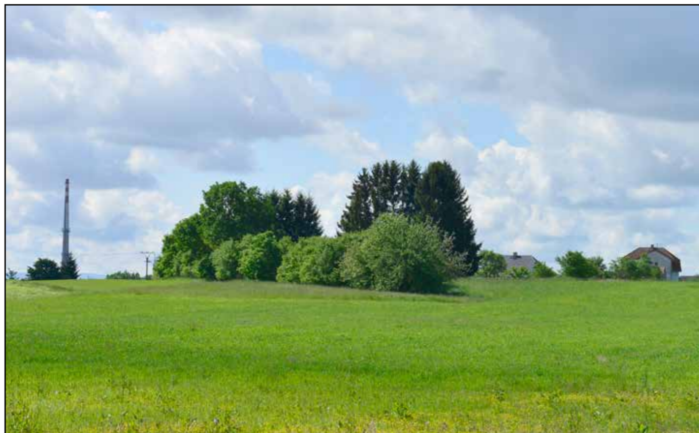
Pohled na severní ústí zřezu, 2022.