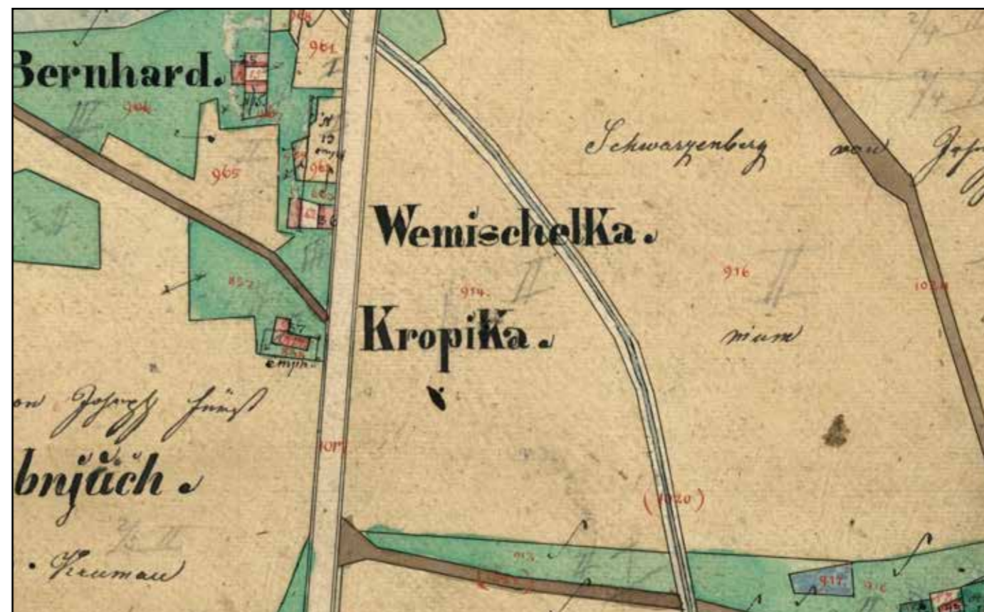
Lokalizace zřezu na indikační skice stabilního katastru, 1827-1868.