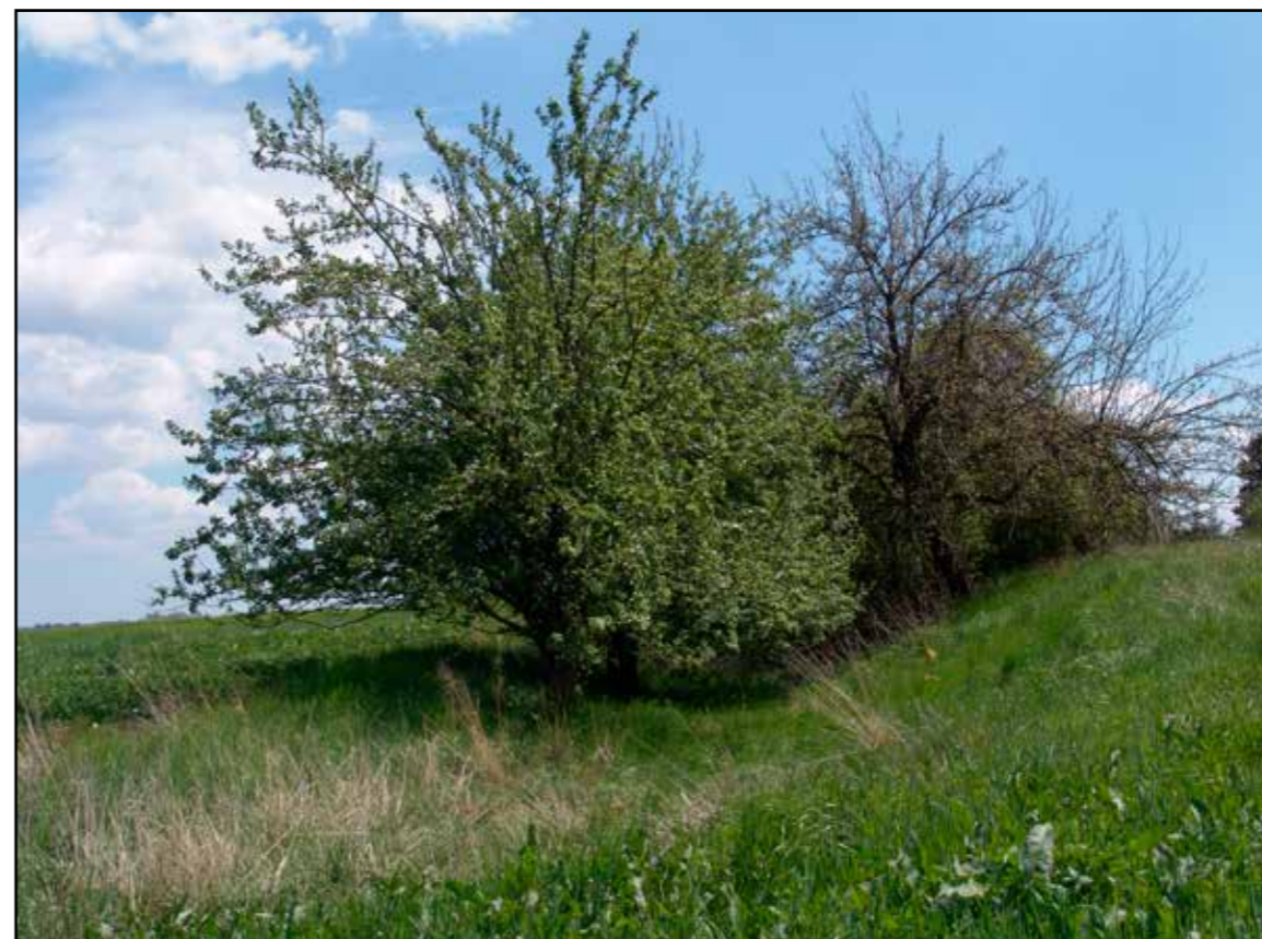
Profil zřezu, 2007.