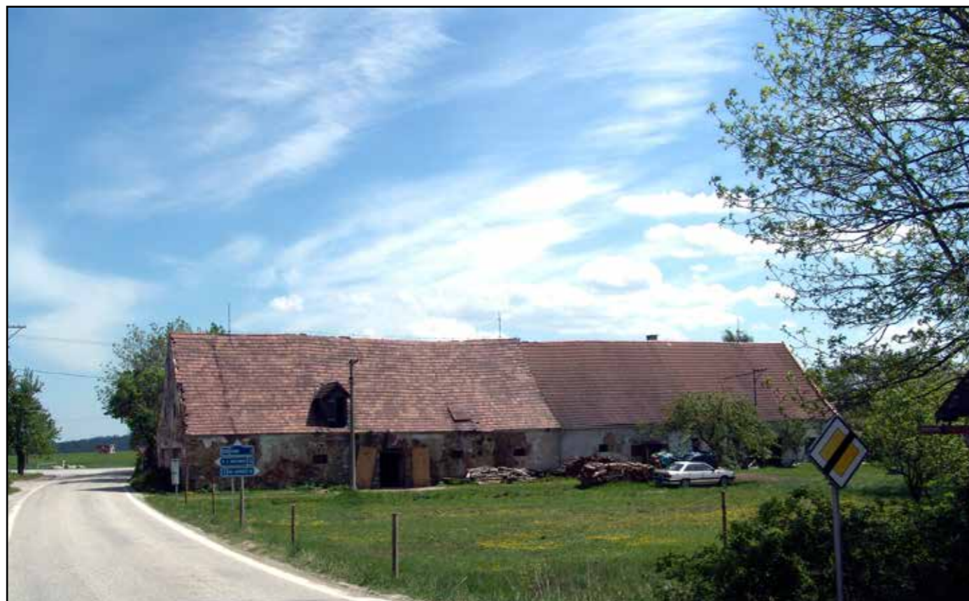
Pohled na budovu stájí od západu, 2007.