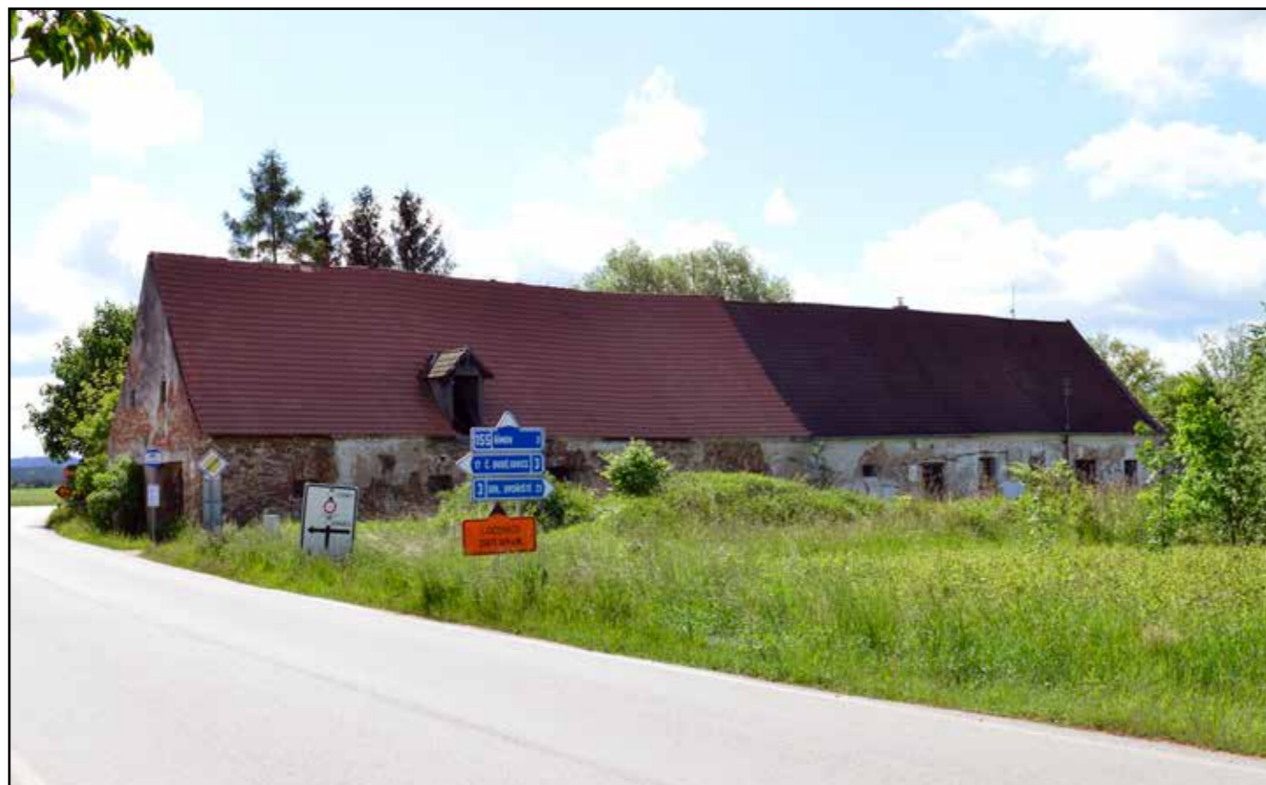
Pohled na budovu stájí od západu, 2022.