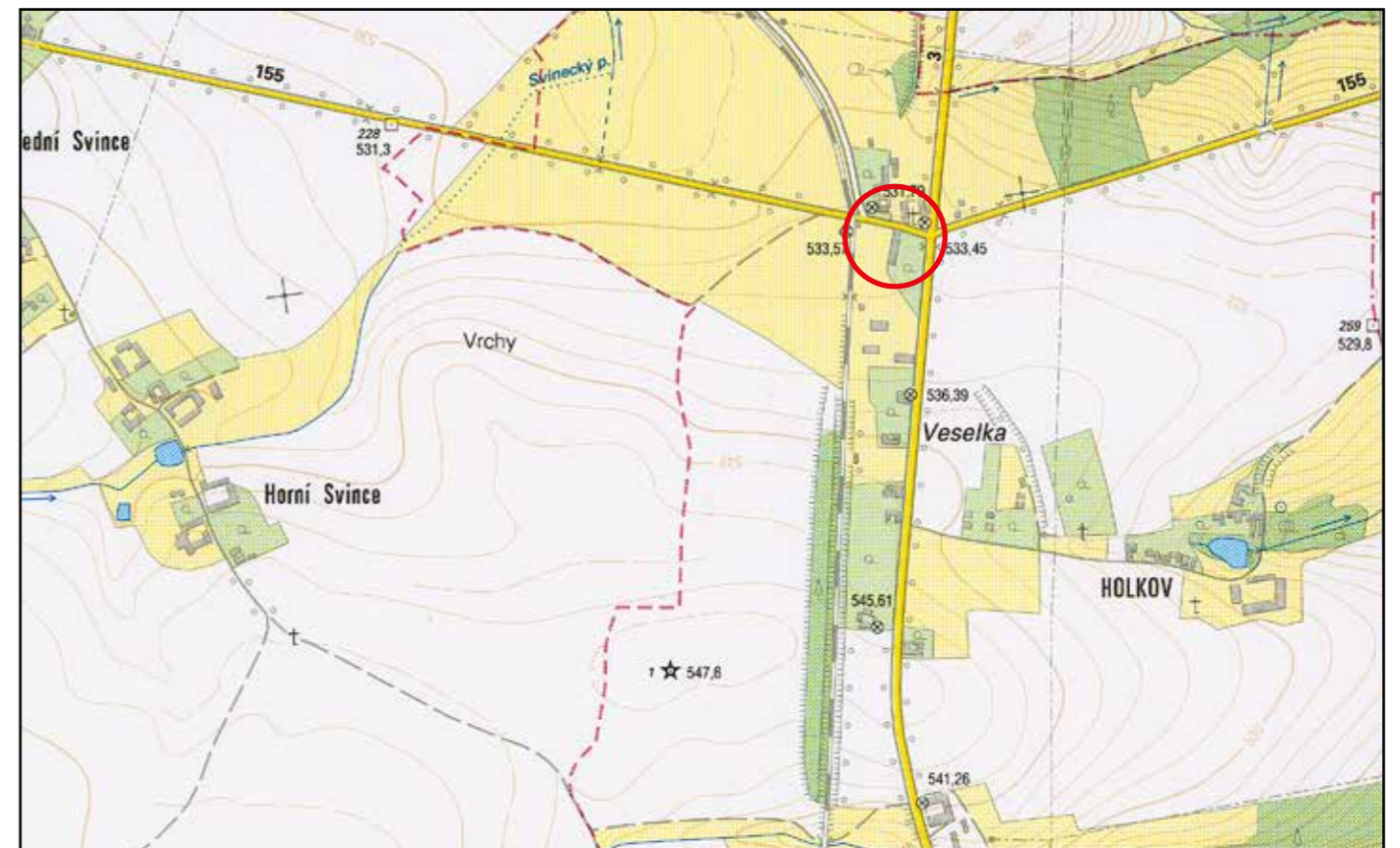
Základní mapa ČR, 2006, M 1 : 10 000.