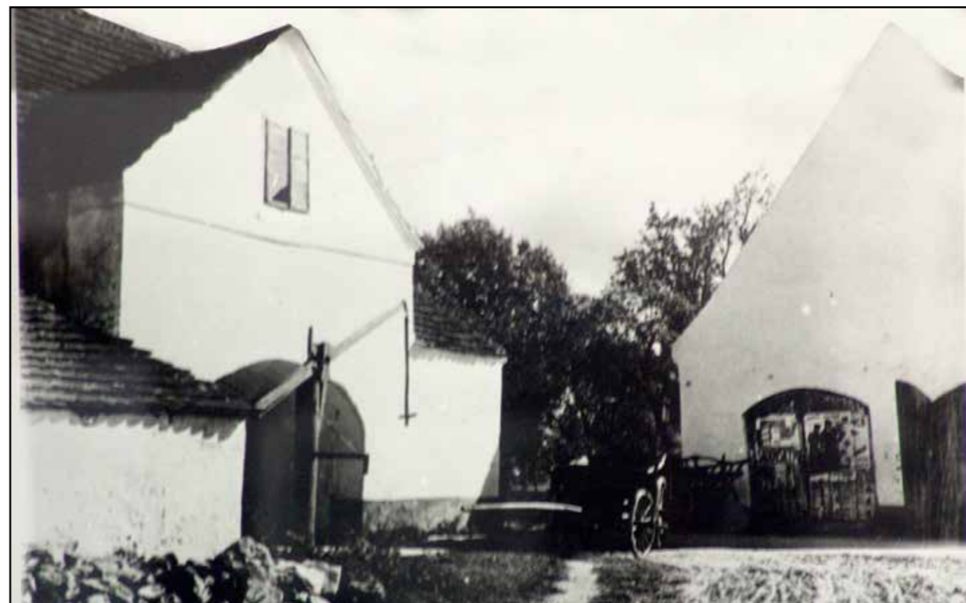
Pohled na severní průčelí stájí, kde jsou patrné původní zaklenuté vstupy. Kolem 1925.