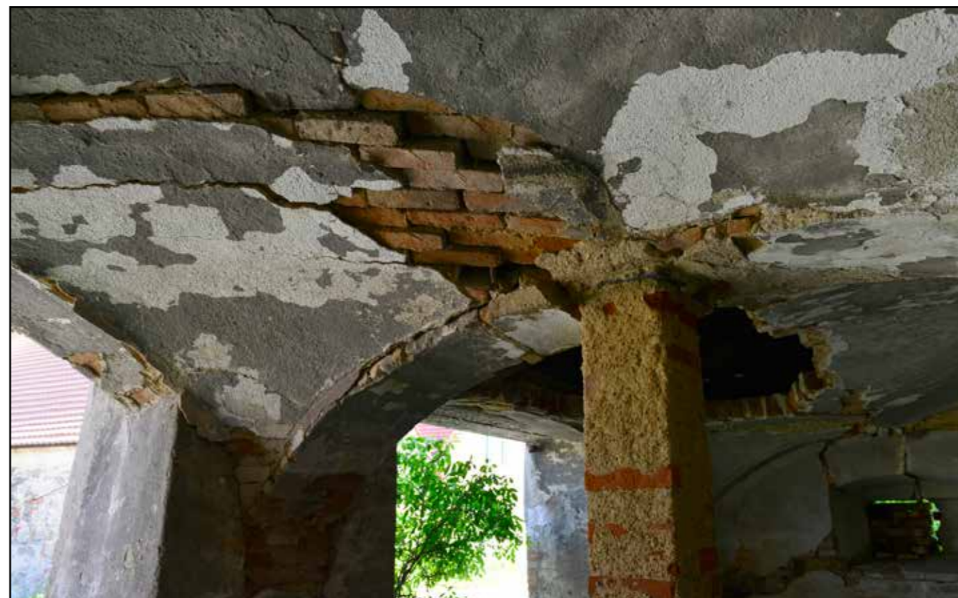
Interiér stájí – detail poškozené klenby, 2022.