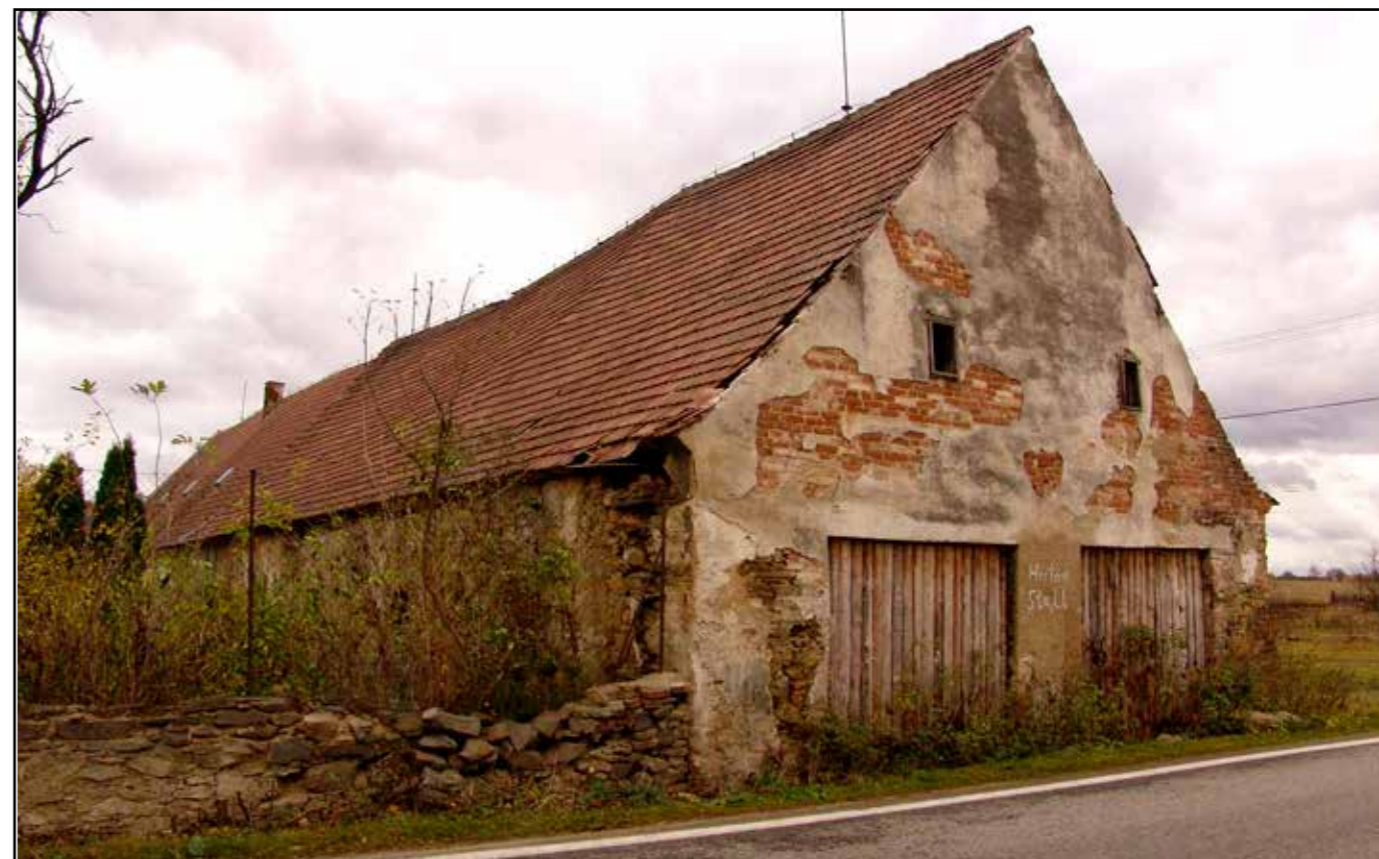
Severní průčelí stájí, pohled od severovýchodu.