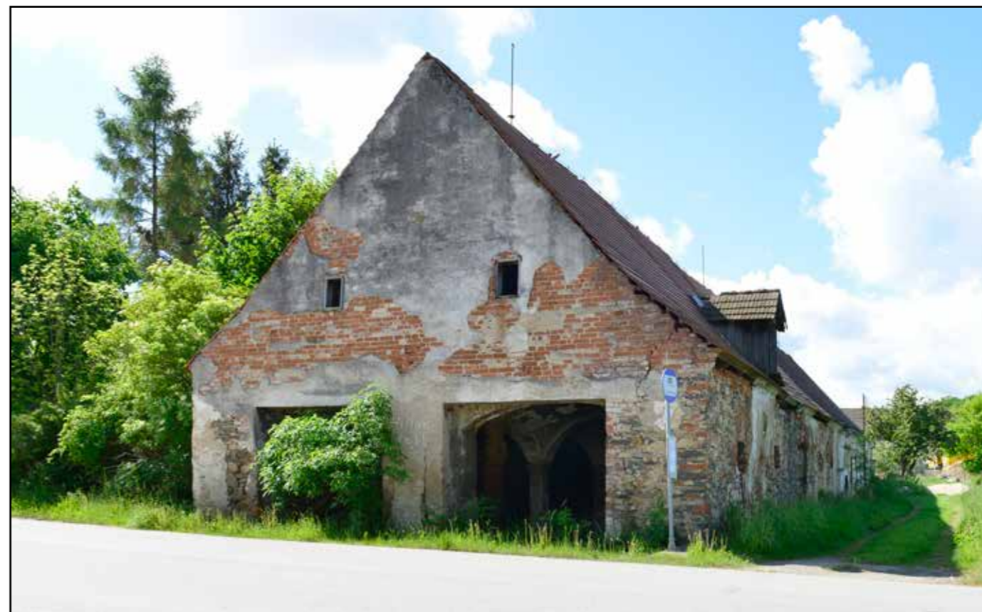
Severní průčelí stájí, pohled od severozápadu, 2022.