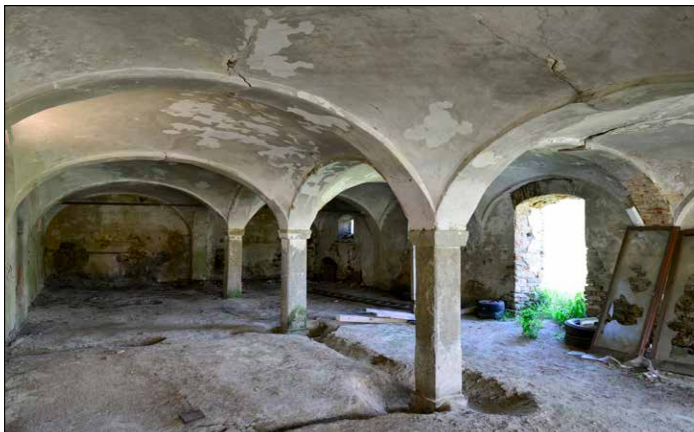
Interiér stájí, 2022.