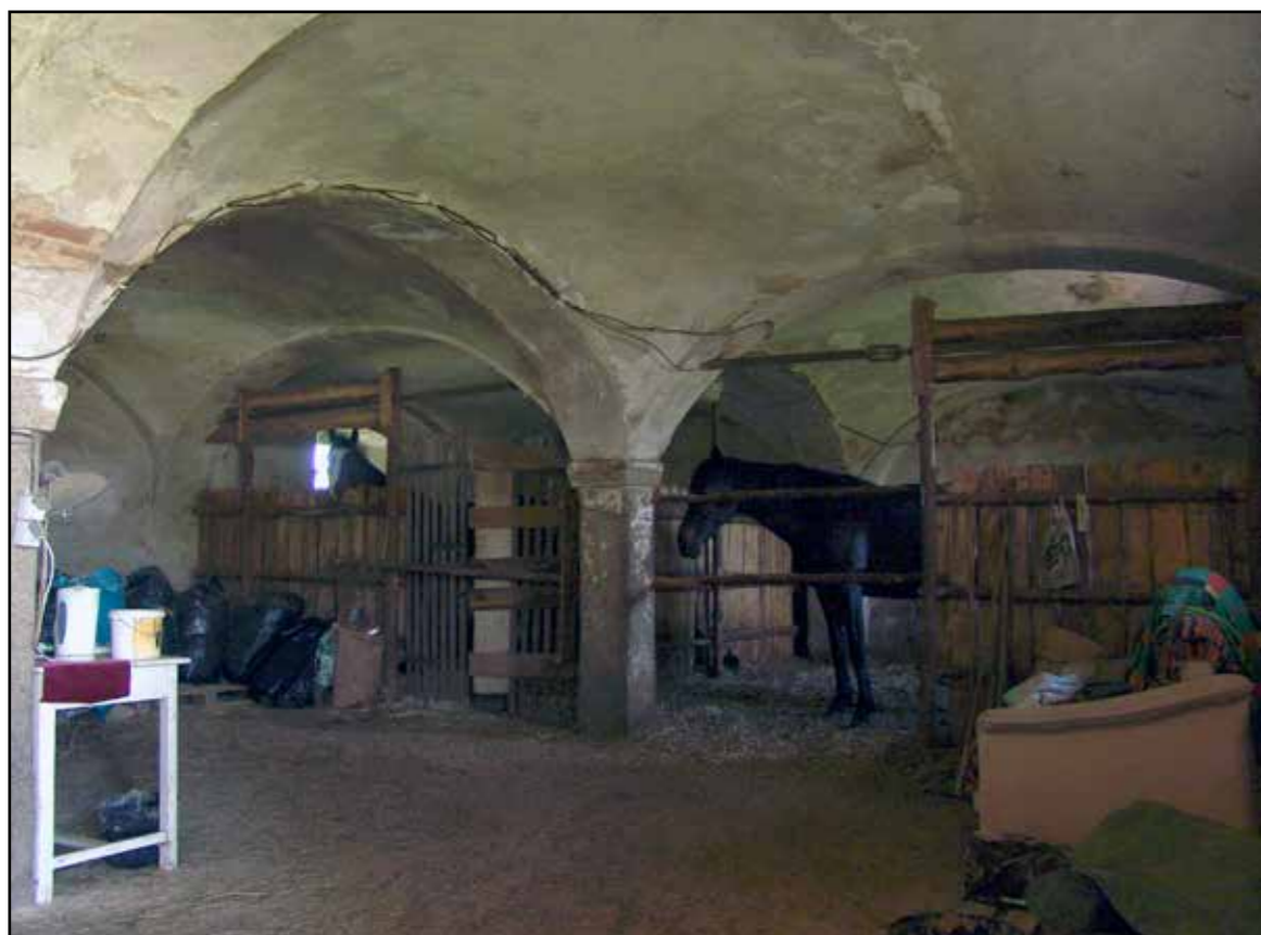
Interiér stájí, 2007.