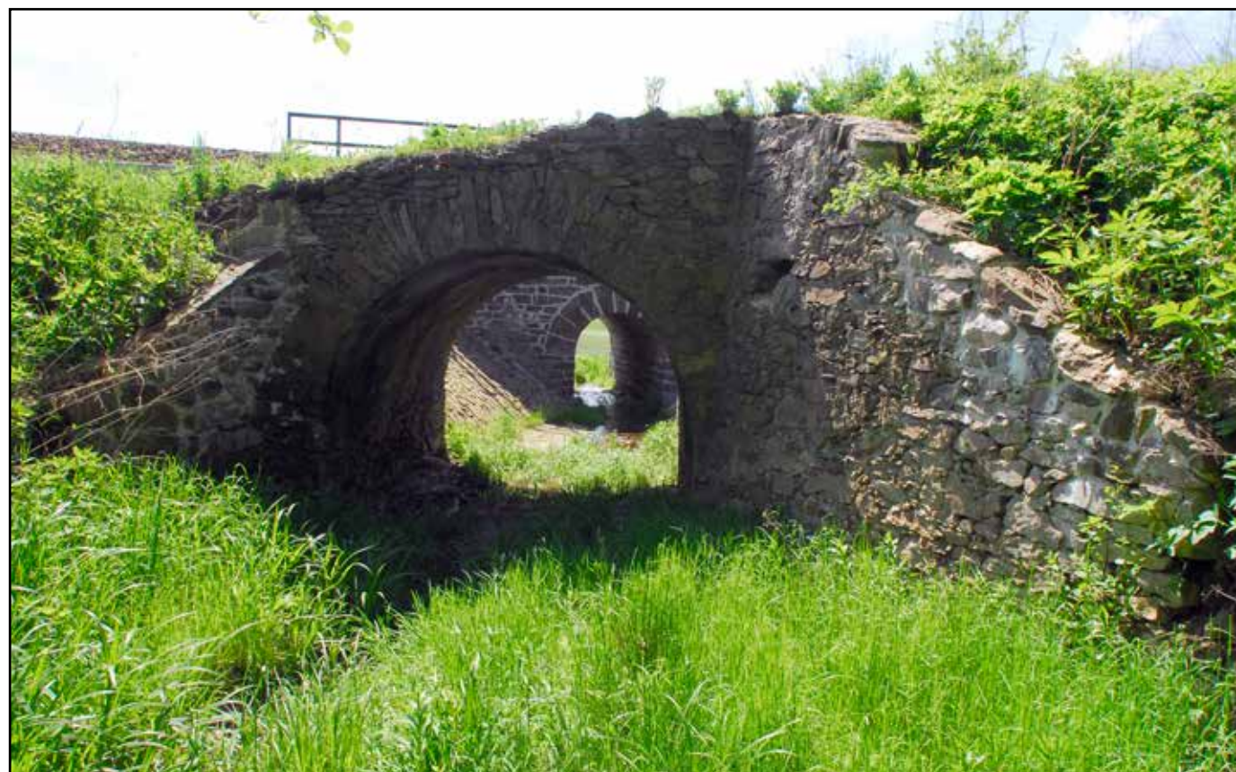
Klenutý můstek, pohled severovýchodu, 2022.