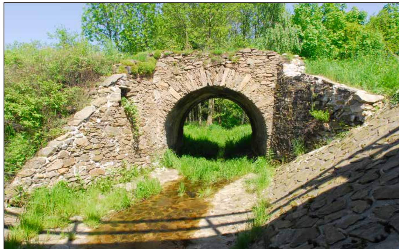
Klenutý můstek, pohled od západu, 2022.