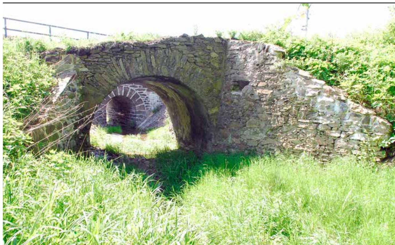
Klenutý můstek, pohled východu, 2022.