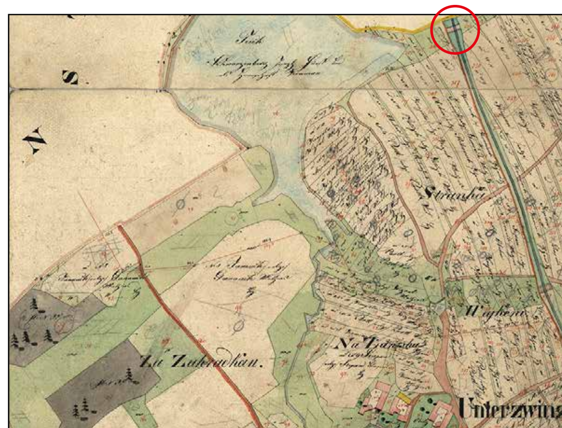
Lokalizace můstku v náspu na indikační skice stabilního katastru, 1827-1868.