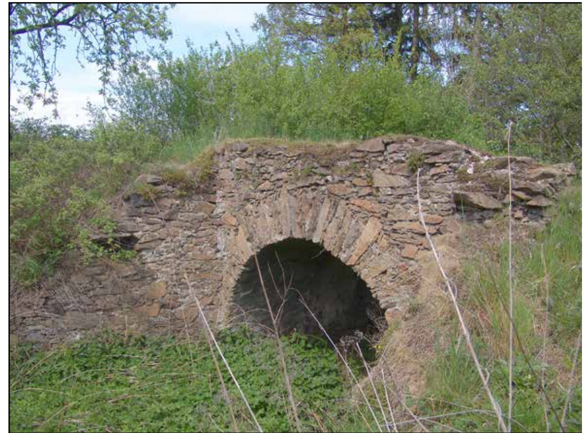
Klenutý můstek, pohled od západu, 2007.