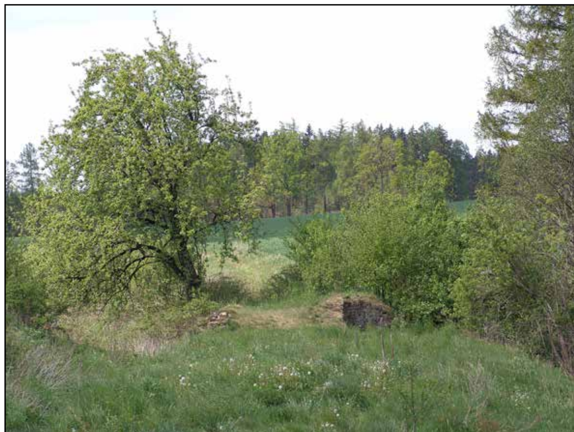
Pohled po náspu koněspřežky od jihozápadu, 2007.