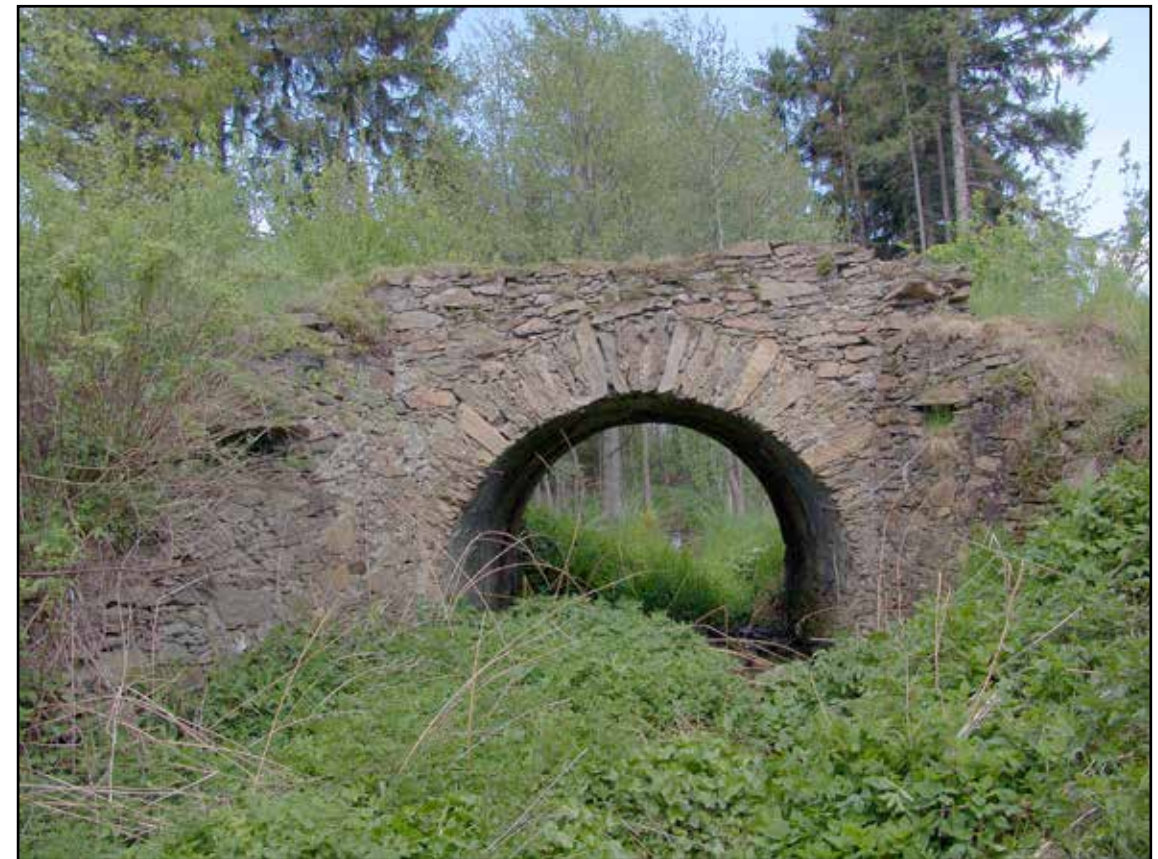
Klenutý můstek, pohled od severozápadu, 2007.