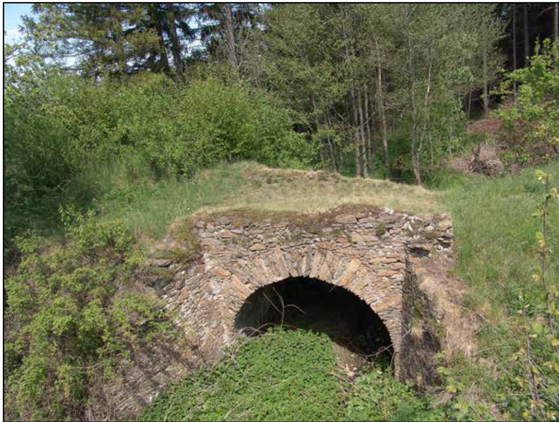
Klenutý můstek, pohled od severozápadu od železničního náspu, 2007.