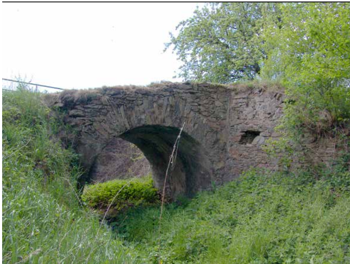
Klenutý můstek, pohled od jihu, 2007.