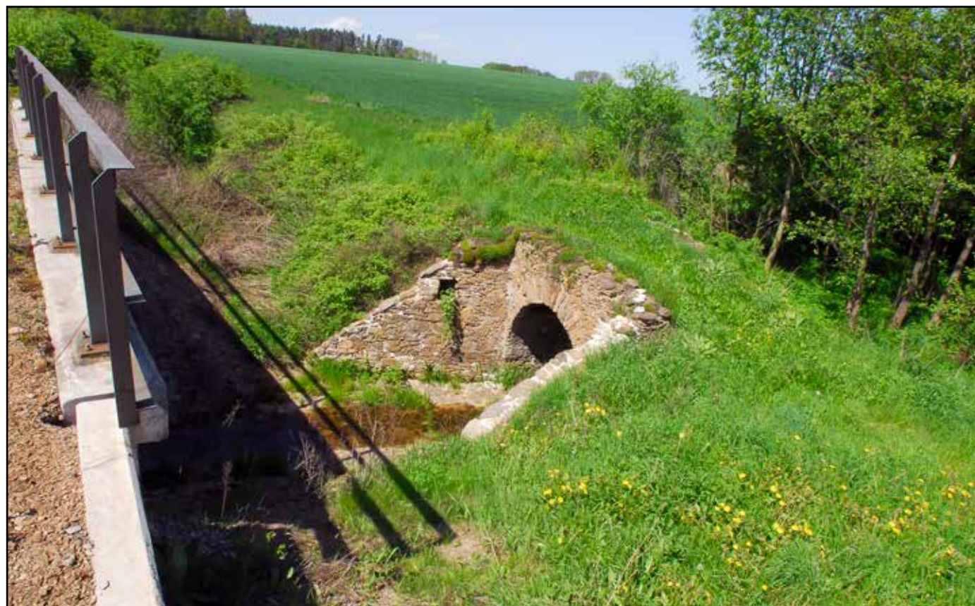
Klenutý můstek, pohled od jihu od železničního náspu, 2022.