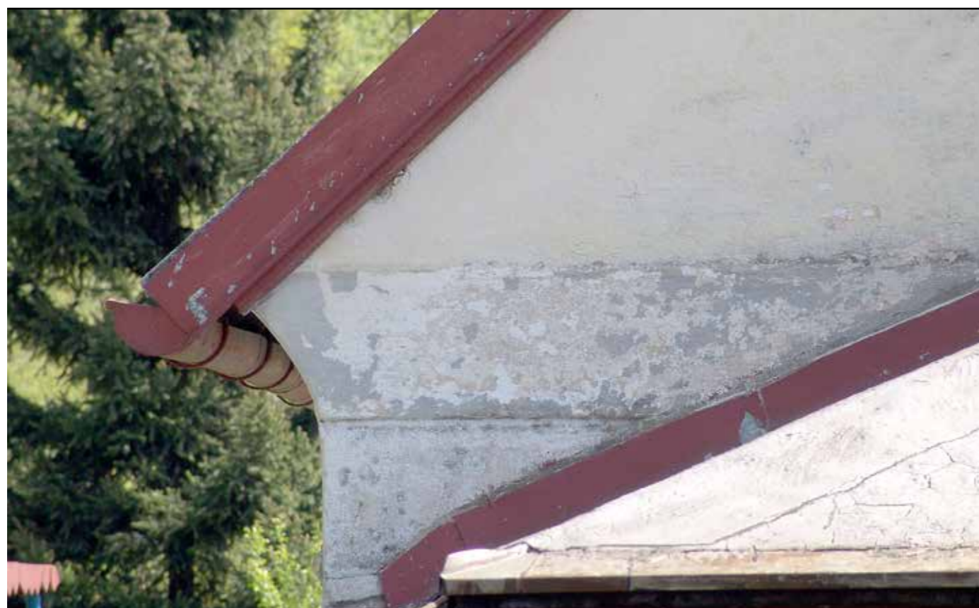
Detail pásu z hlazené omítky oddělující štít na severní straně, 2007.