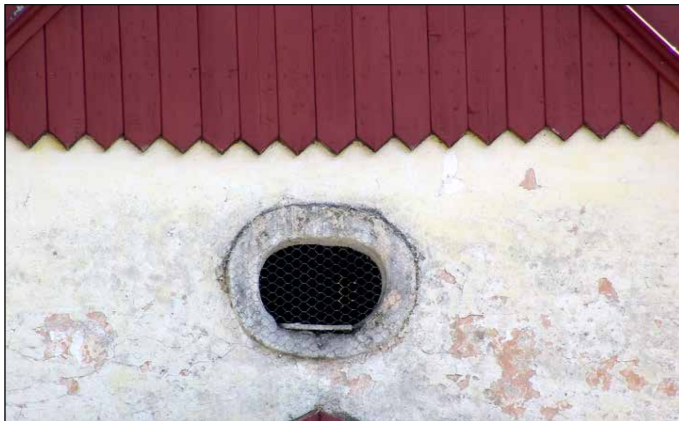
Detail oválného okénka v severním štítě, 2007.