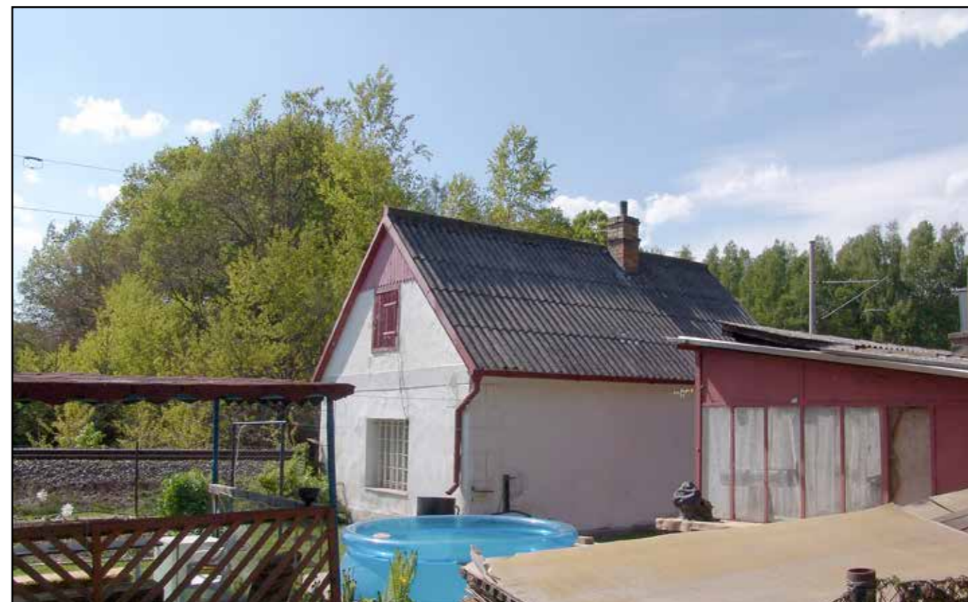
SD Chlumeč, pohled od jihovýchodu, 2007.