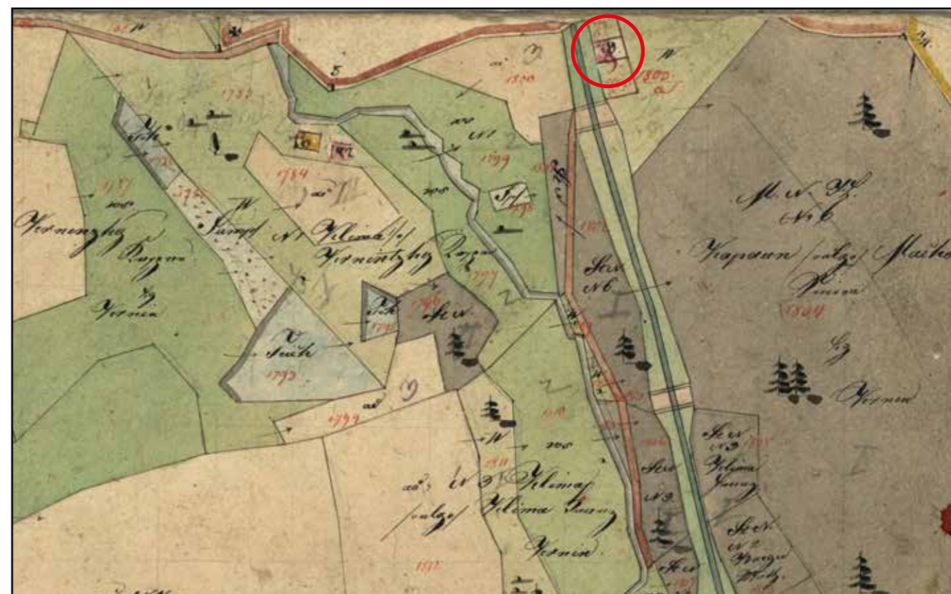
Lokalizace strážního domku na indikační skice stabilního katastru, 1827-1868.