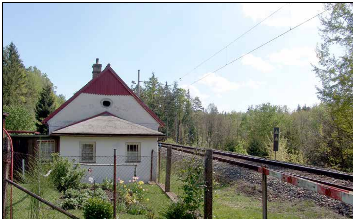
SD Chlumeč, severní průčelí, 2007.