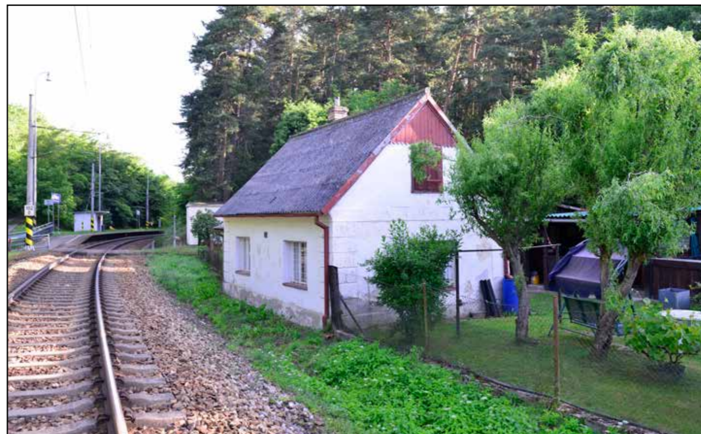
SD Chlumeč, celkový pohled od jihozápadu, 2022