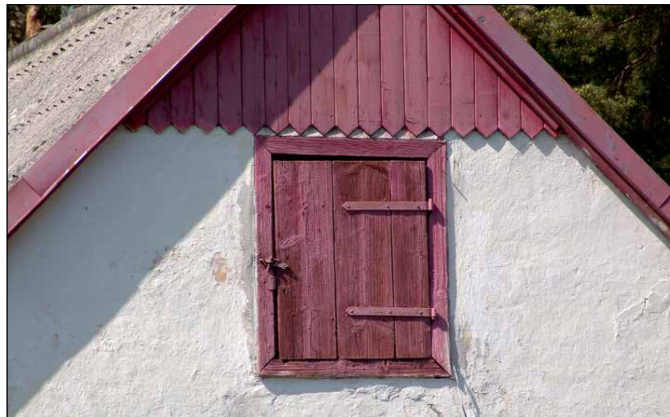
Dřevěná dvířka v jižní štítové zdi, 2007.