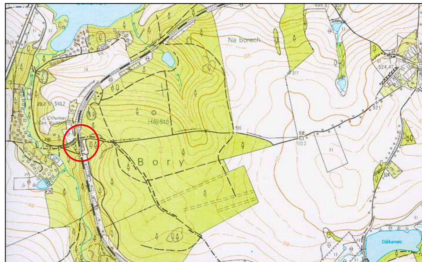
Základní mapa ČR, 2006, M 1 : 10 000.