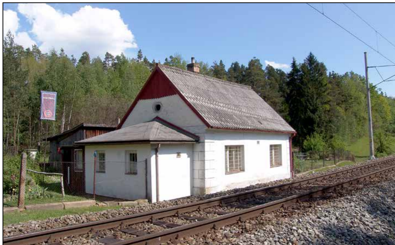
SD Chlumeč, celkový pohled od severozápadu, 2007.