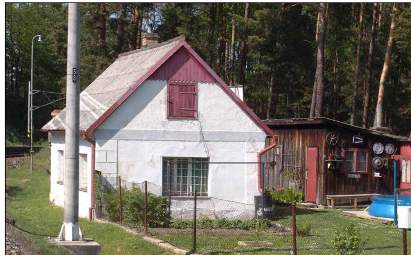
SD Chlumeč, celkový pohled od jihozápadu, 2007.