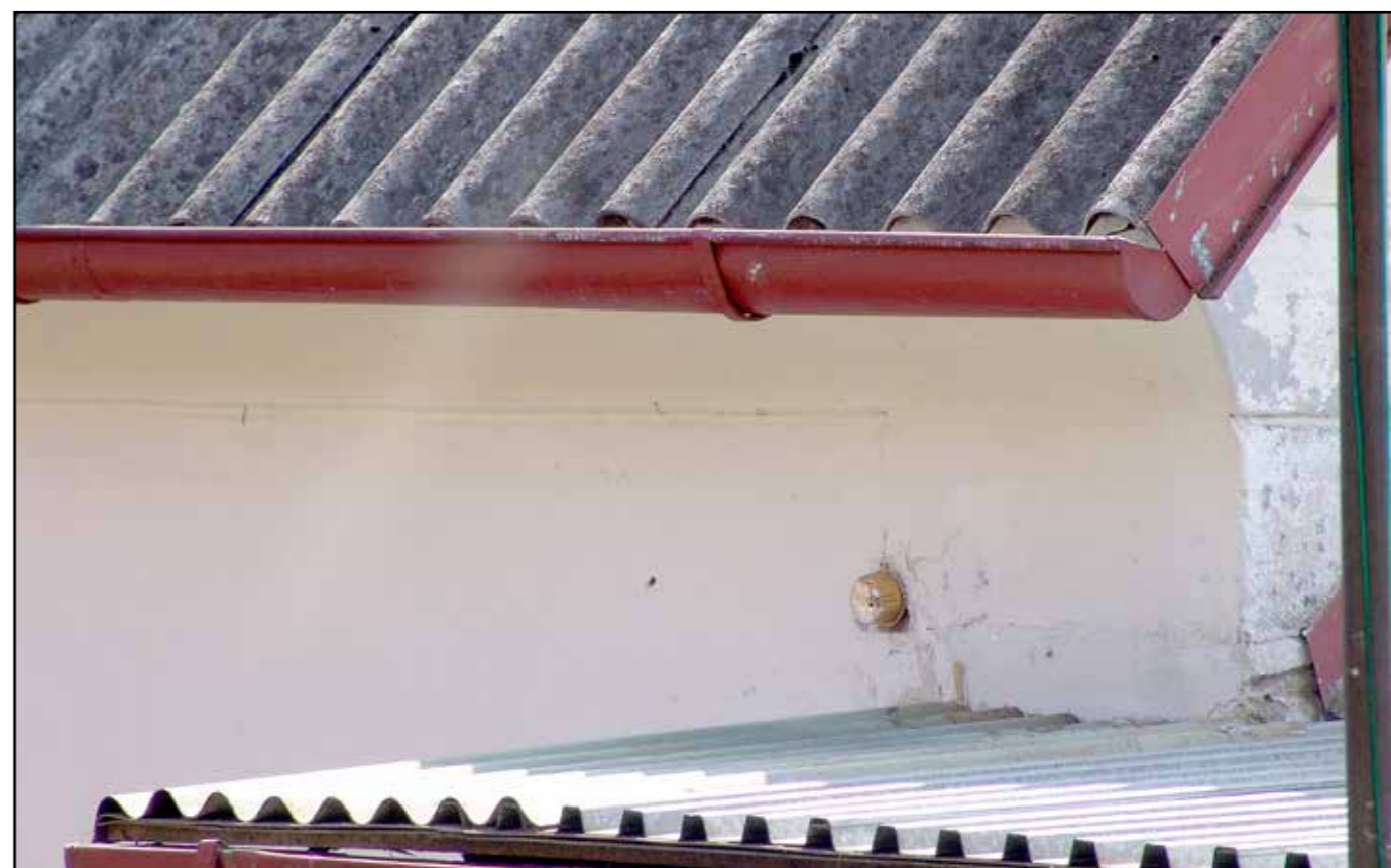
Detail severovýchodního nároží, 2007.