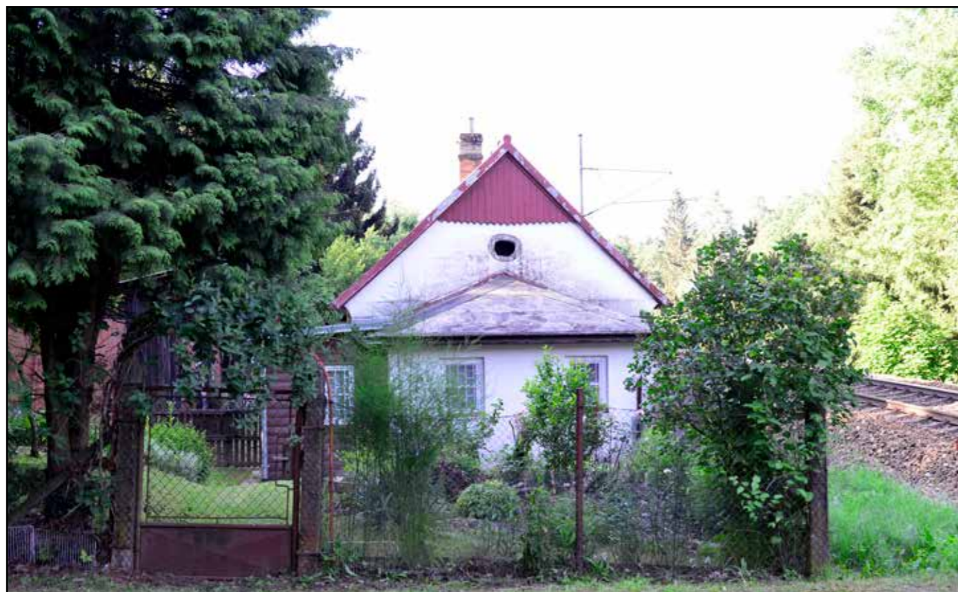
SD Chlumeč, severní průčelí, 2022.