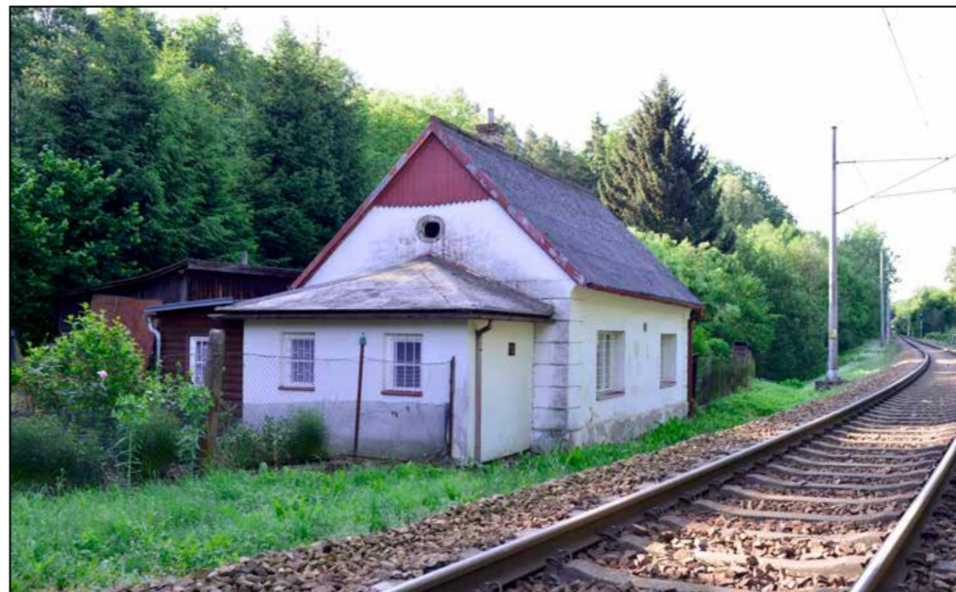
SD Chlumeč, celkový pohled od severozápadu, 2022.