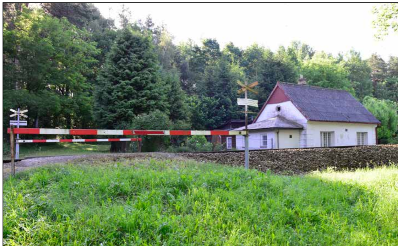
SD Chlumeč, celkový pohled od severozápadu, 2022.