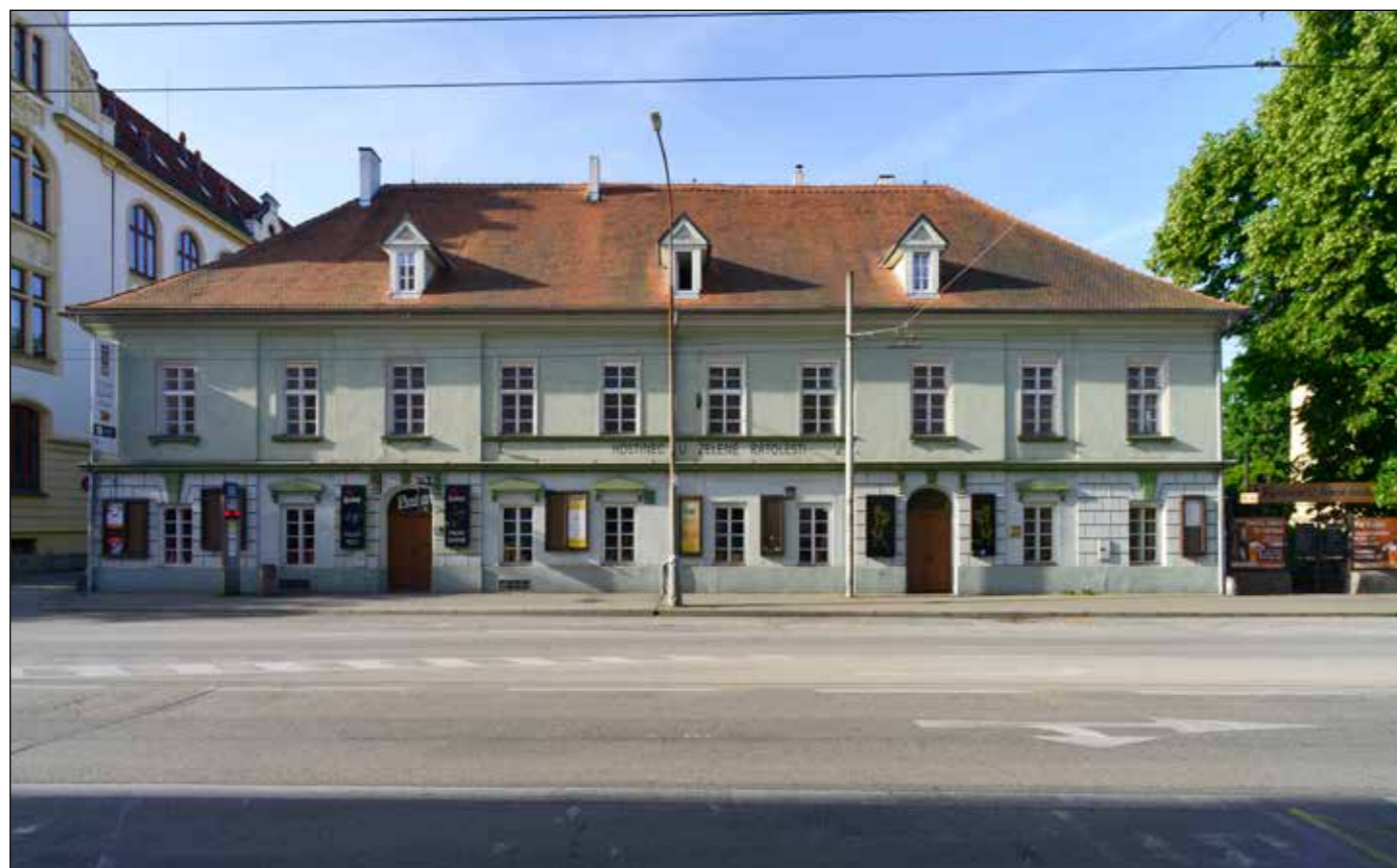
Hostinec U Zelené ratolesti, pohled od severu, 2022.