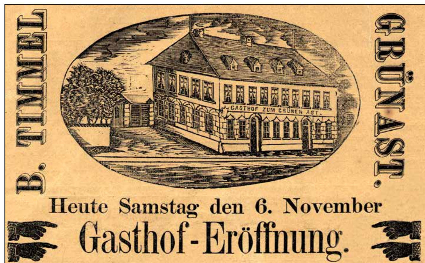
Dobová inzerce s vyobrazením hostince U Zelené ratolesti, 1869.