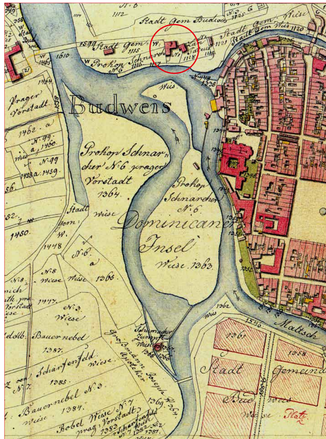
Nový a starý hostinec U Zelené ratolesti na plánu města z roku 1828.

Ke konkrétní památce nebylo vyhlášeno, nachází se na území vyhlášeného ochranného pásma hradebního systému města Č. Budějovice.