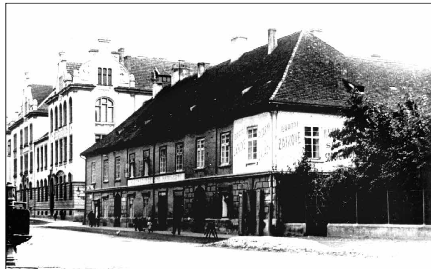
Hostinec U Zelené ratolesti, 30. léta 20. století.