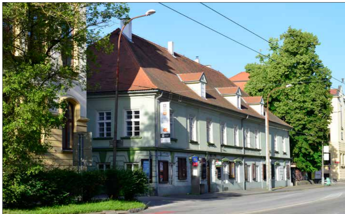
Hostinec U Zelené ratolesti, severovýchodní nároží, 2022.