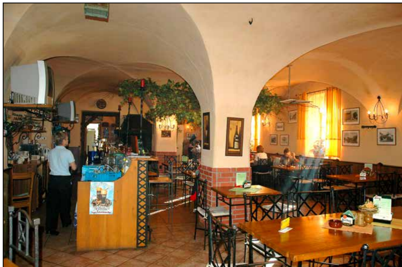
Interiér hostince U Zelené ratolesti, 2007.