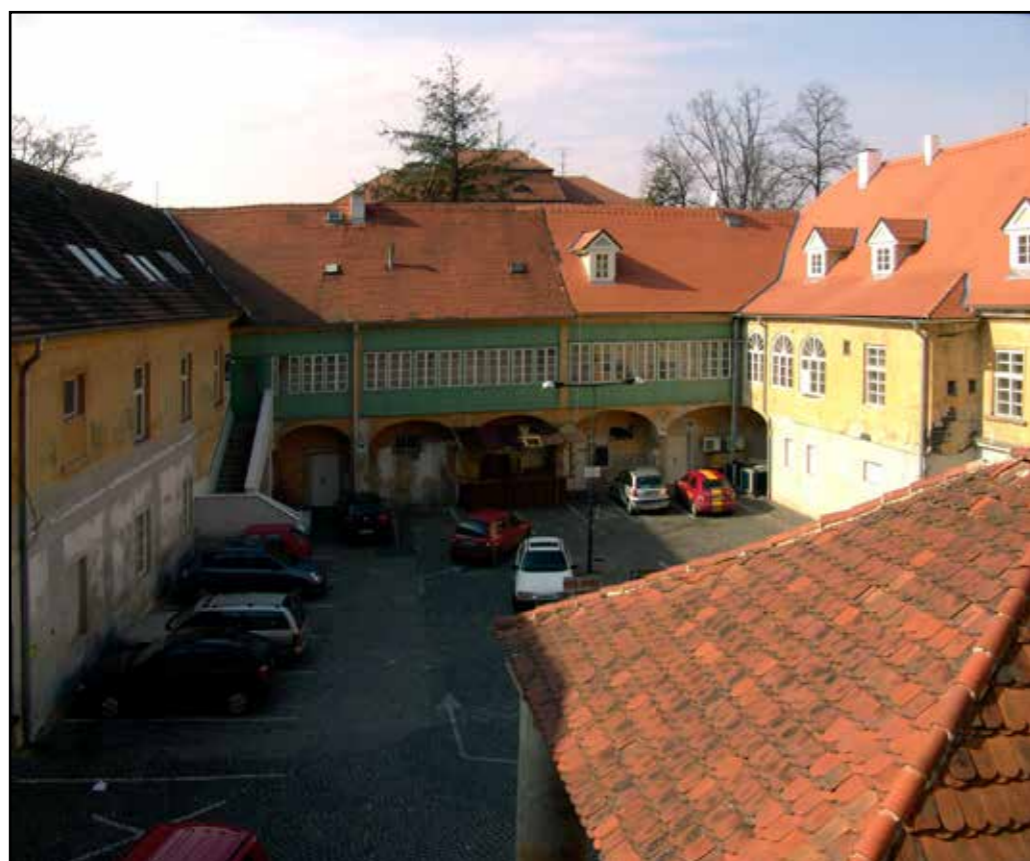
Hostinec U Zelené ratolesti, pohled přes střechu kočárovny do dvora, 2007.