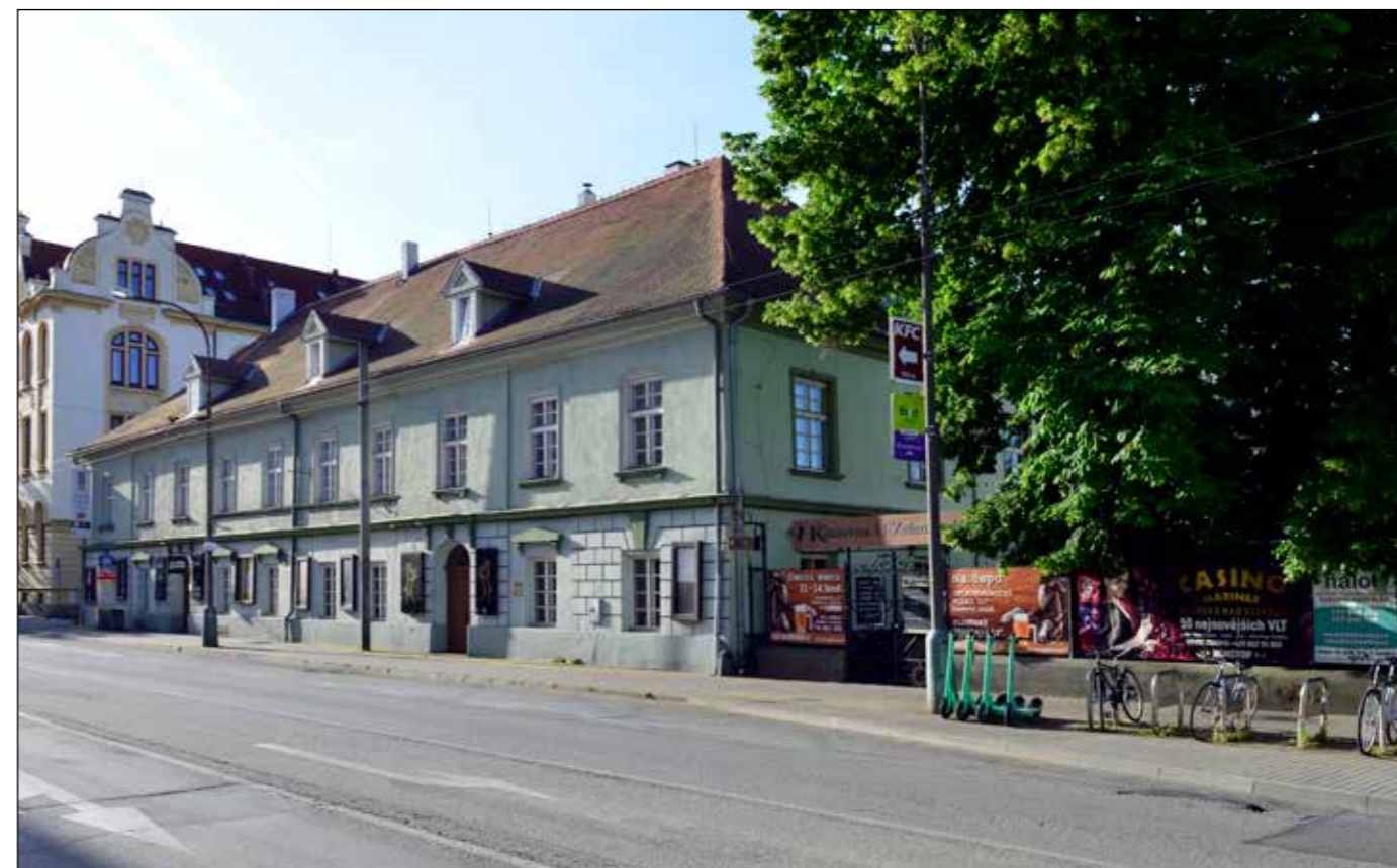
Hostinec U Zelené ratolesti, pohled od severozápadu, 2022.