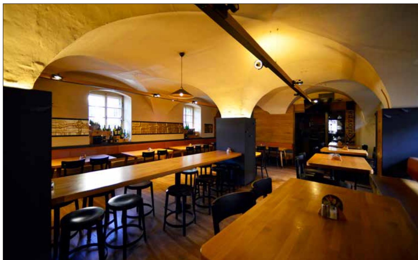
Hostinec U Zelené ratolesti, přízemí západního křídla, kde byly původně umístěny stáje. Prostor po renovaci dnes slouží jako restaurace, 2022.