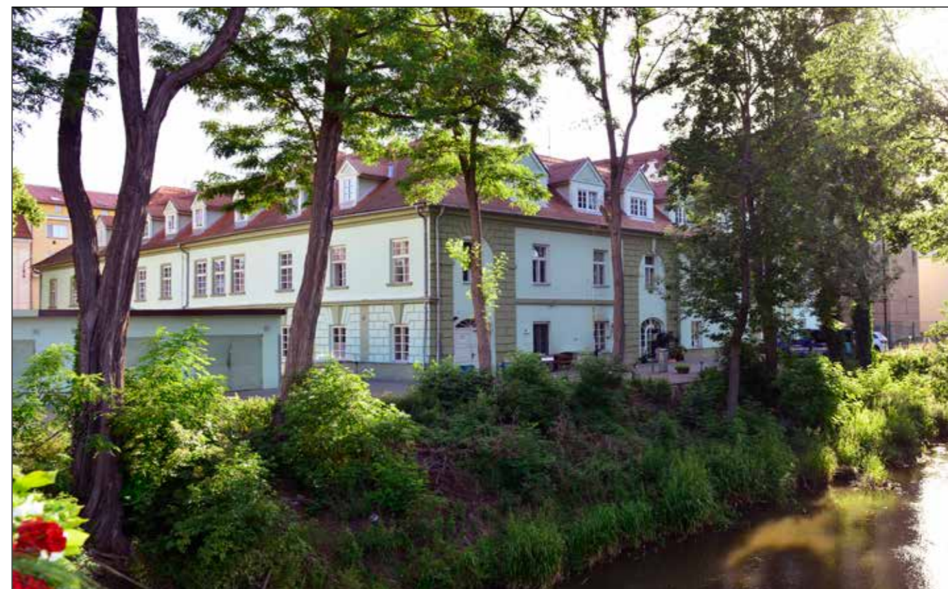
Hostinec U Zelené ratolesti, pohled od jihozápadu, 2022