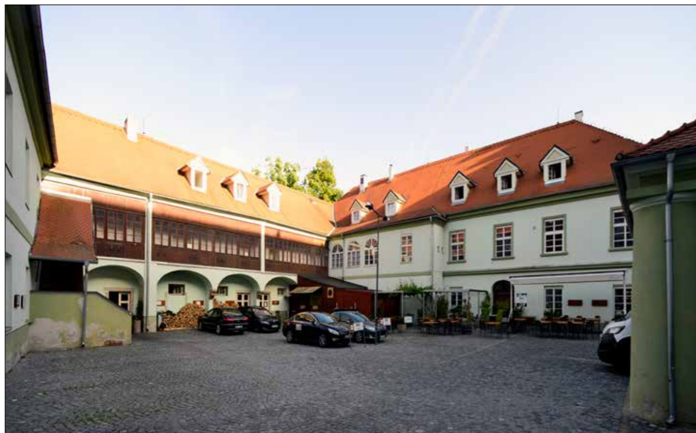
Hostinec U Zelené ratolesti, dvůr – pohled na severní a západní křídlo, 2022.