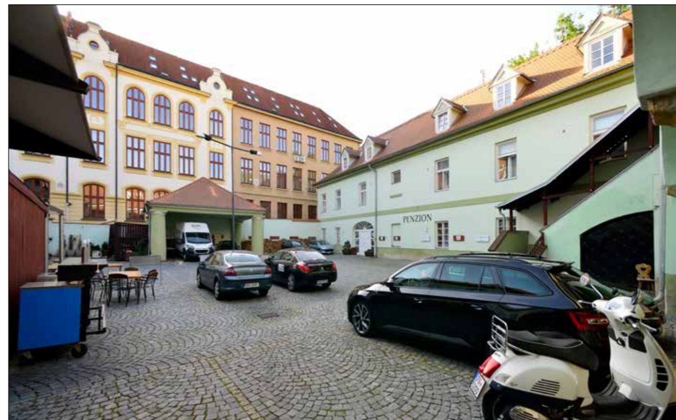
Hostinec U Zelené ratolesti, dvůr – pohled na jižní křídlo a tzv. kočárovnu na severní straně, 2022.