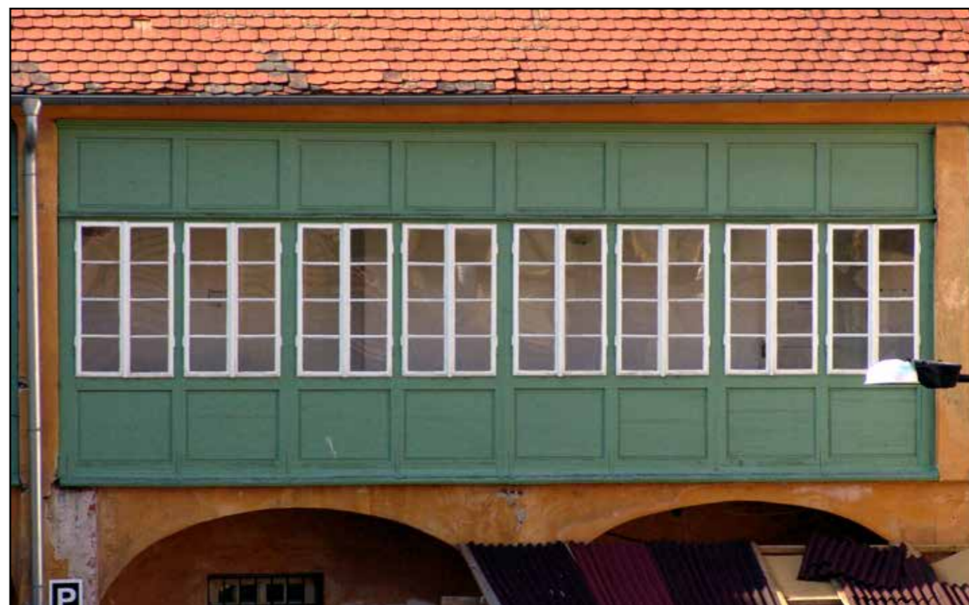
Hostinec U Zelené ratolesti, detail dřevěné pavlače, 2007.