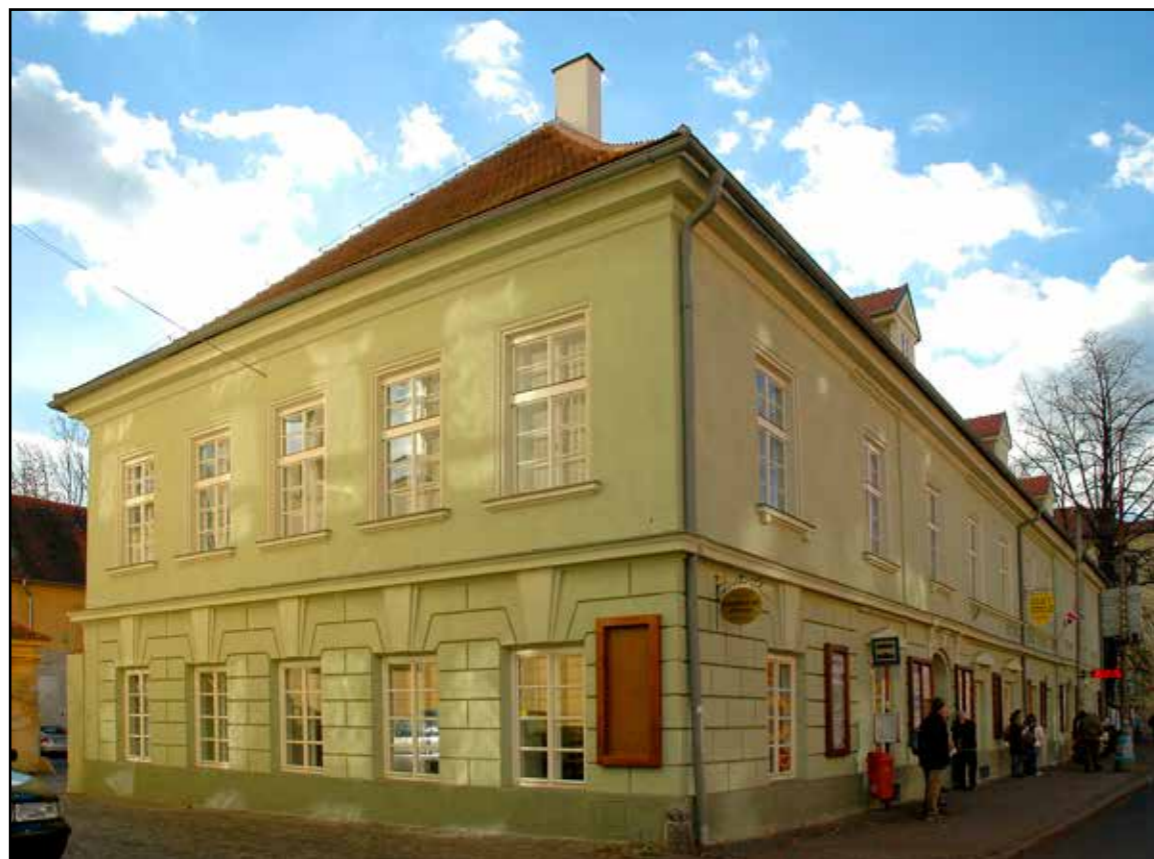
Hostinec U Zelené ratolesti, severovýchodní nároží, 2007.