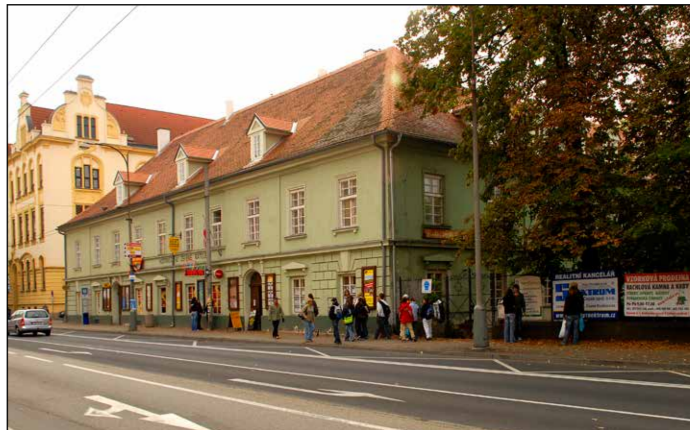
Hostinec U Zelené ratolesti, pohled od severozápadu, 2007.